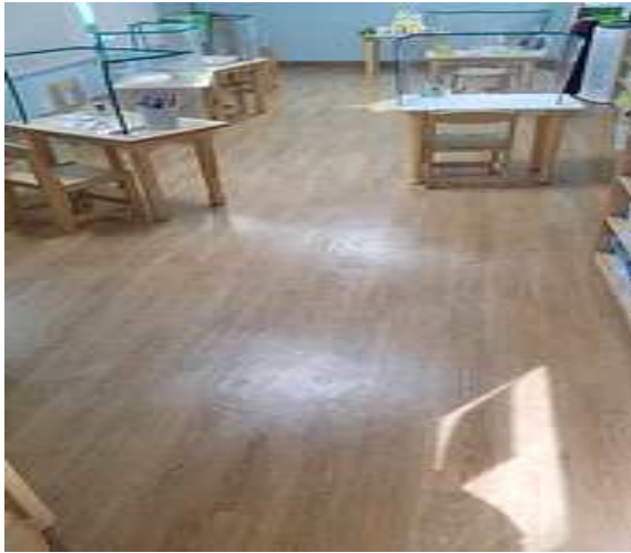
2층 만4,5세 교실