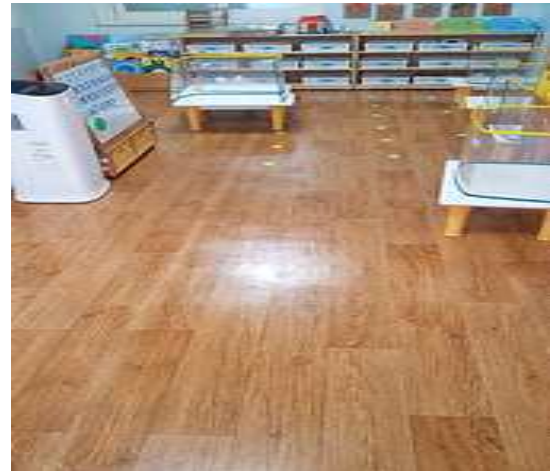
2층 만3세 교실