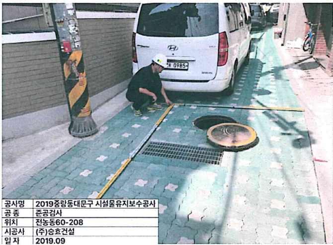
공사명 2019중랑동대문구 시설물유지보수공사 공 종 준공검사 위치 전농동60-208 시공사 (주)승효건설 일자 2019.09