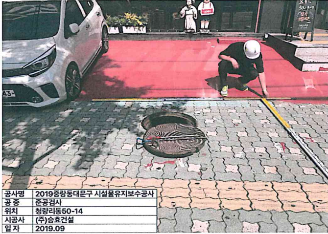
공사명 2019중랑동대문구 시설물유지보수공사 공 종 준공검사 위치 청량리동50-14 시공사 (주)승효건설 일자 2019.09