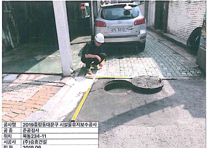
공사명 2019중랑동대문구 시설물유지보수공사 공 종 준공검사 위치 목동234-11 시공사 (주)승효건설 일자 2019.09