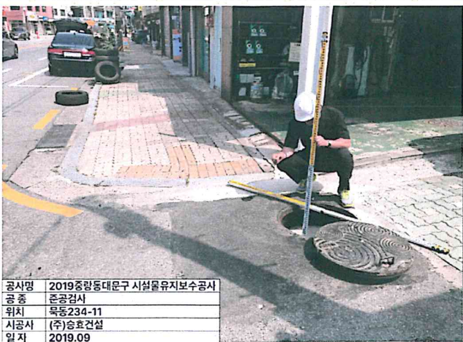
공사명 2019중랑동대문구 시설물유지보수공사 공 종 준공검사 위치 목동234-11 시공사 (주)승효건설 일자 2019.09