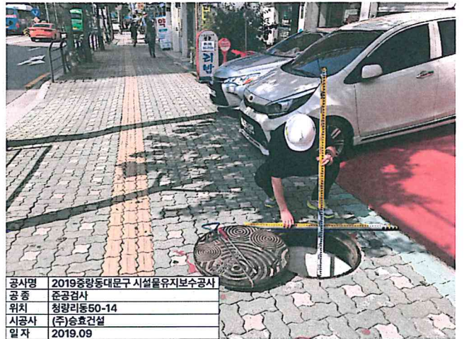
공사명 2019중랑동대문구 시설물유지보수공사 공 종 준공검사 위치 청량리동50-14 시공사 (주)승효건설 일자 2019.09