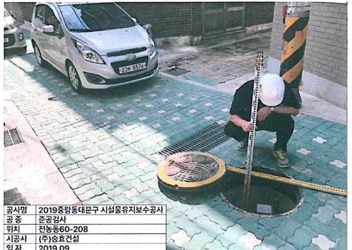
공사명 2019중랑동대문구 시설물유지보수공사 공 종 준공검사 위치 전농동60-208 시공사 (주)승효건설 일자 2019.09