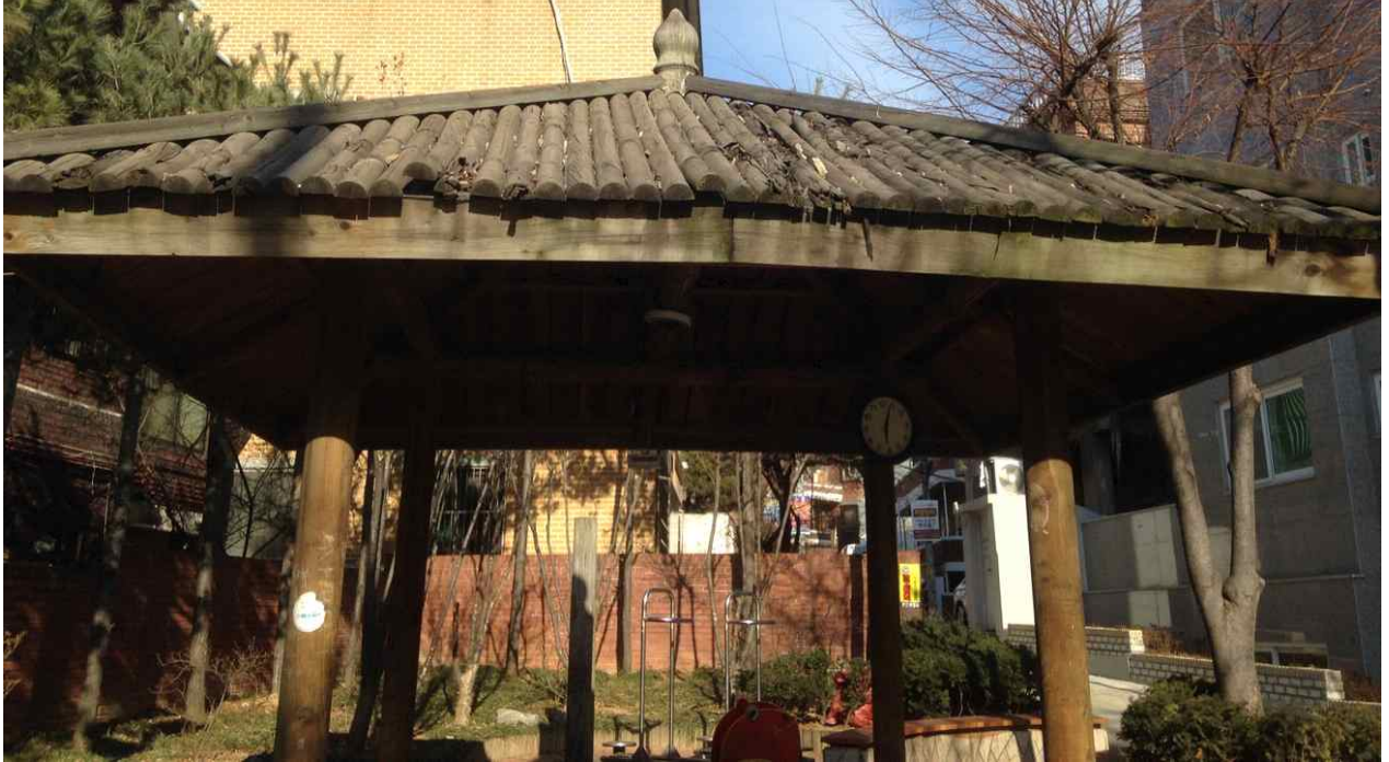
현 황 사 진 ( 세 부 )