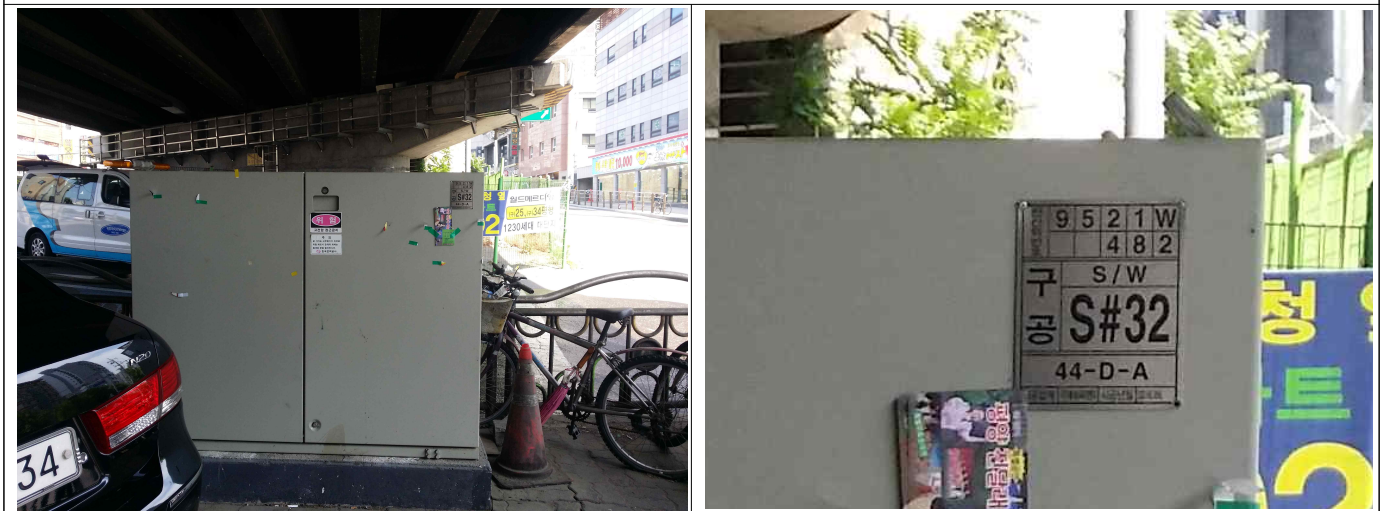
변전소1 (P3 ~ P4 사이에 위치)