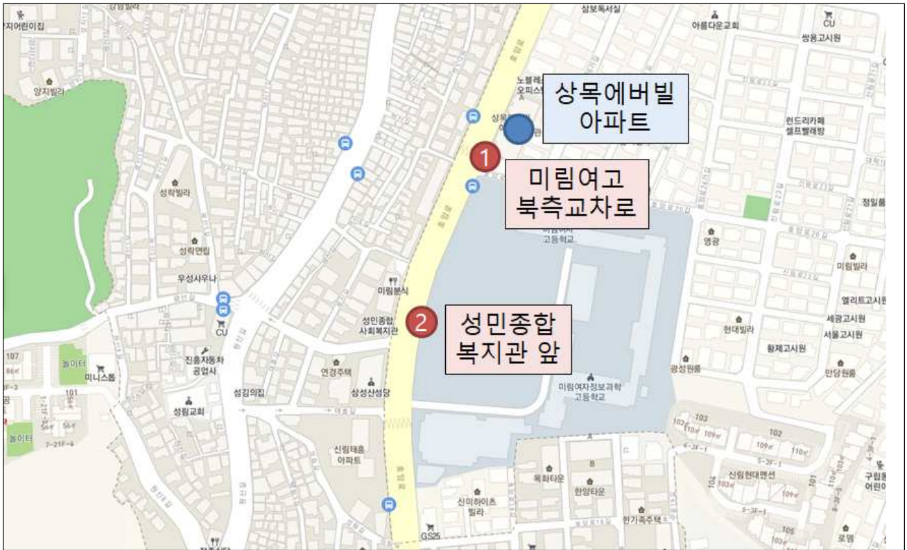
〈위 치 도〉