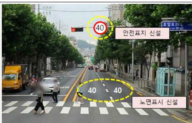
〈미림여고 북측 교차로〉