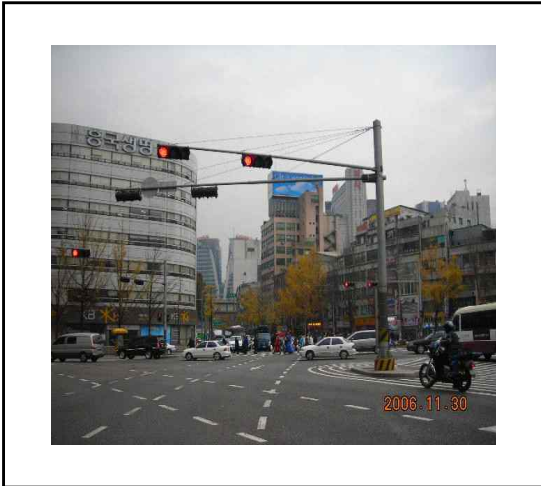
〈사진 1. 주변배경과 함께 촬영〉