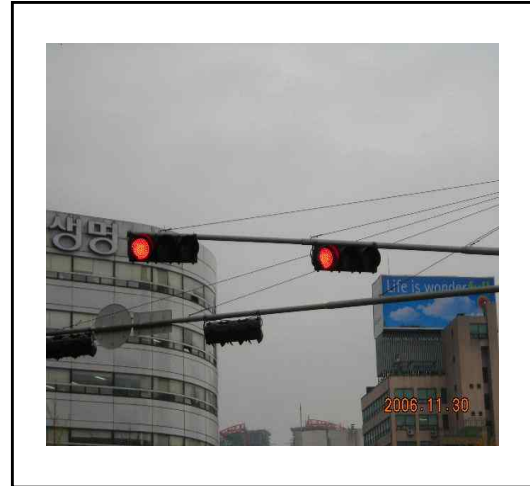
〈사진 2. 시설물 근접 촬영〉