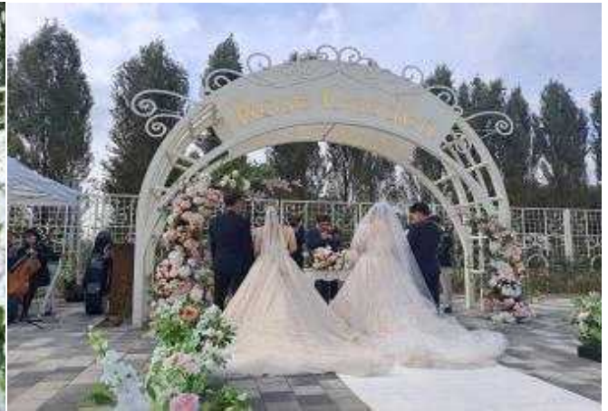
‘23년 상반기 장미원 결혼식 진행모습(6.11)