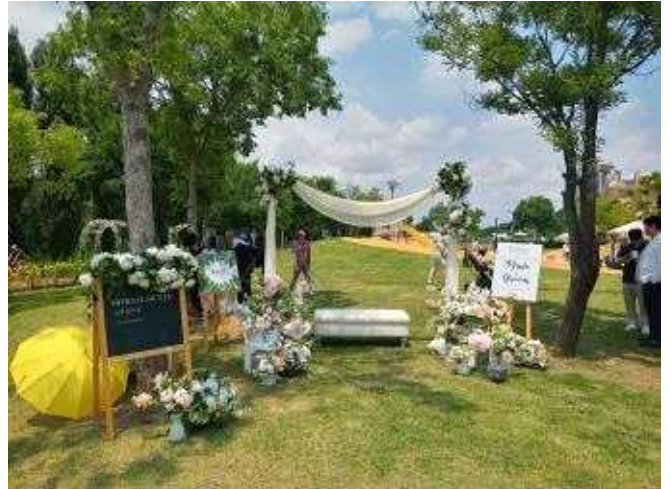
광나루 장미원 신부대기실 전경