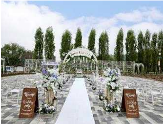
광나루 장미원 결혼식장 전경