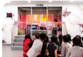
지진 발생시 대처방법

규모 7.0까지 지진을 직접 체험해보고 지진발생시 대처요령을 배우는 곳입니다.