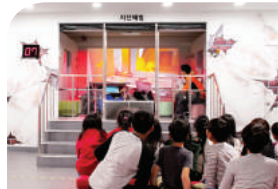
지진 발생시 대처방법

규모 7.0까지 지진을 직접 체험해보고 지진발생시 대처요령을 배우는 곳입니다.