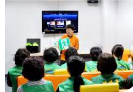
유도등을 활용한 화재대피