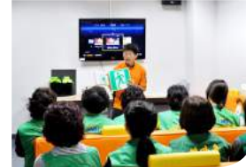
유도등을 활용한 화재대피