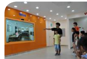
V-Touch를 이용한 간접체험