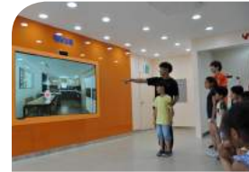
V-Touch를 이용한 간접체험