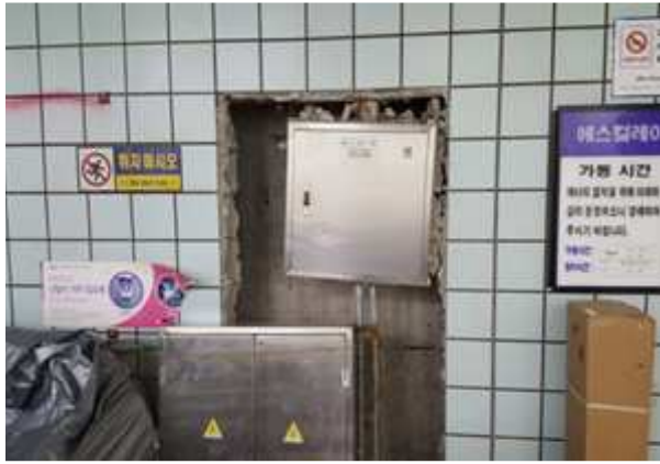
조 치 전