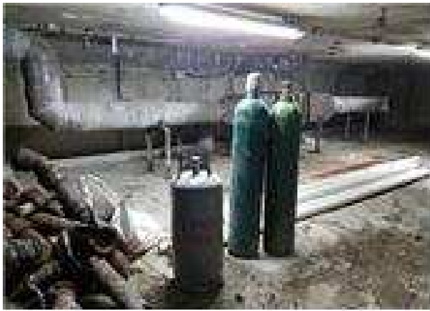
조 치 전