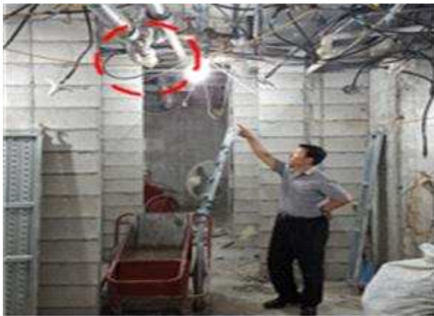
조 치 전