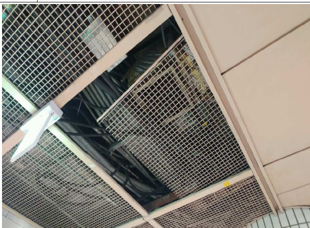
조 치 전