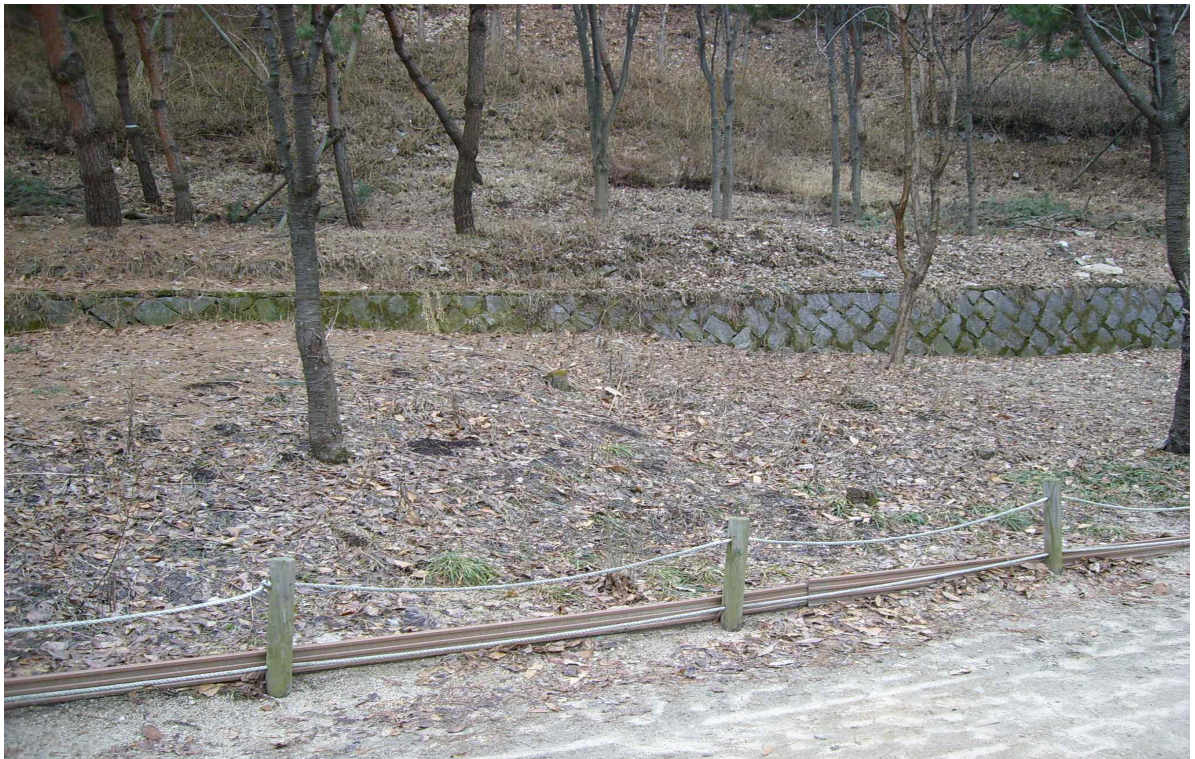
화장실 설치 예정지