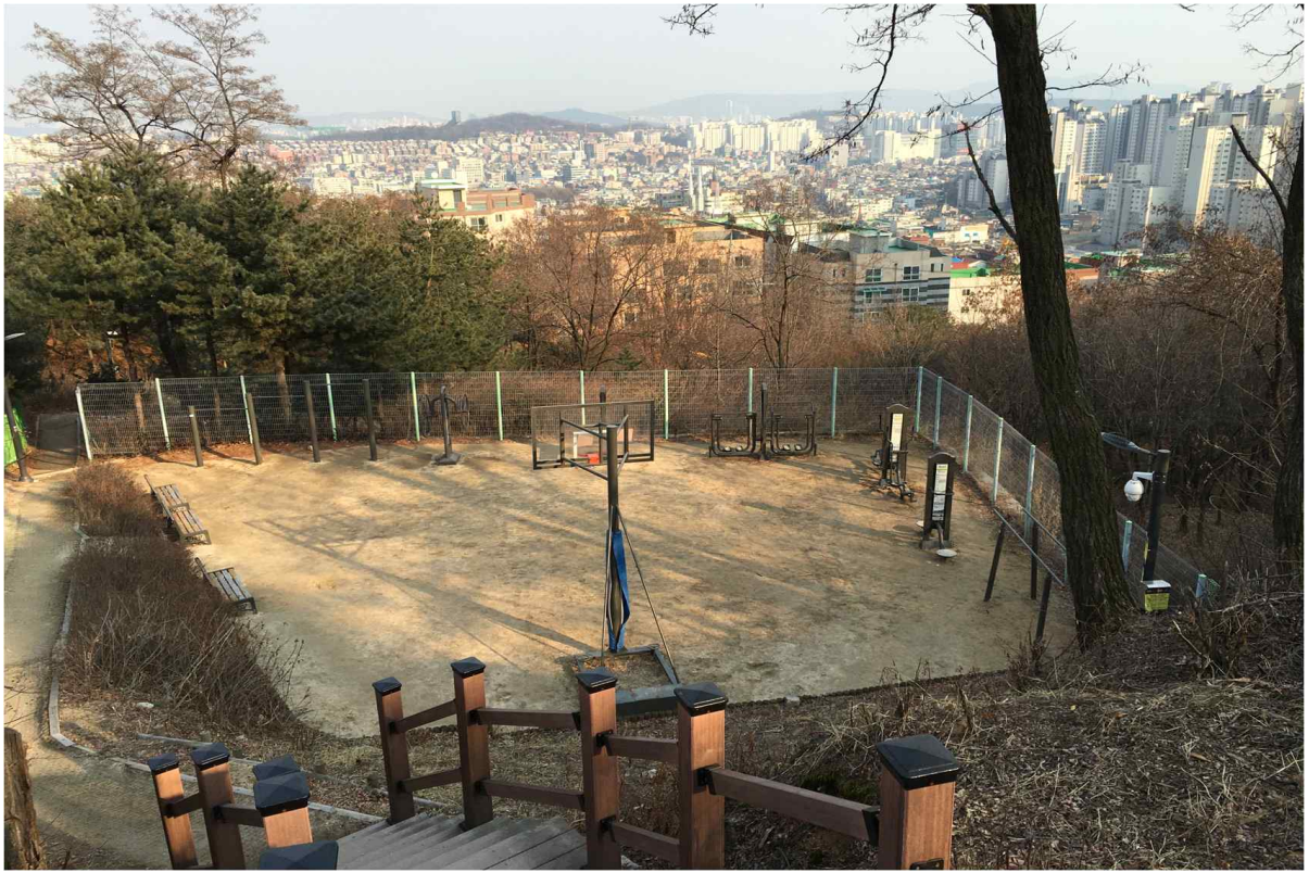
미양쉼터(바닥 포장 대상지)