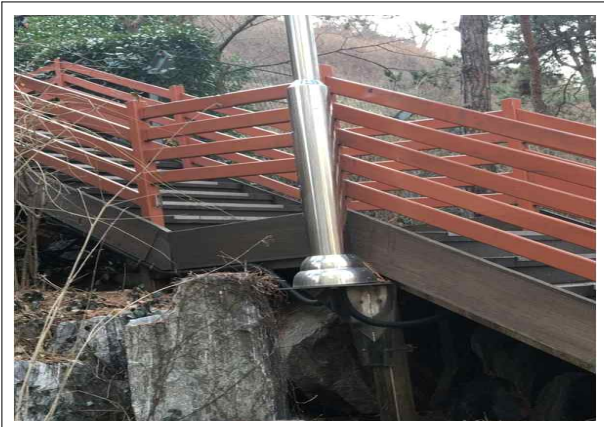
SK 북한산시티아파트 주변 목계단