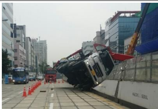
2016.10.1. 9호선 3단계 1구간 크레인 전도