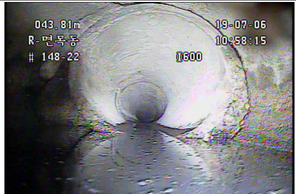
하수관 파손 및 이음부 단차