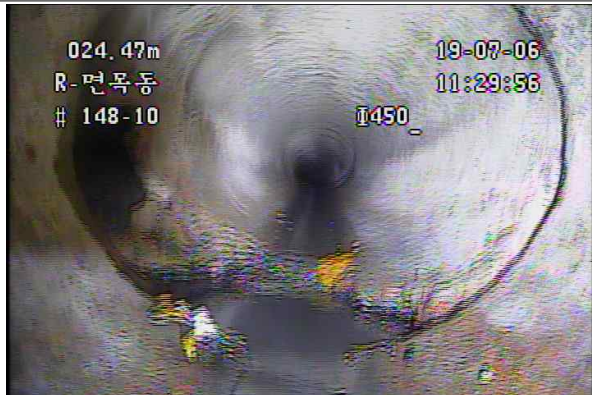
하수관 파손 및 이음부 단차