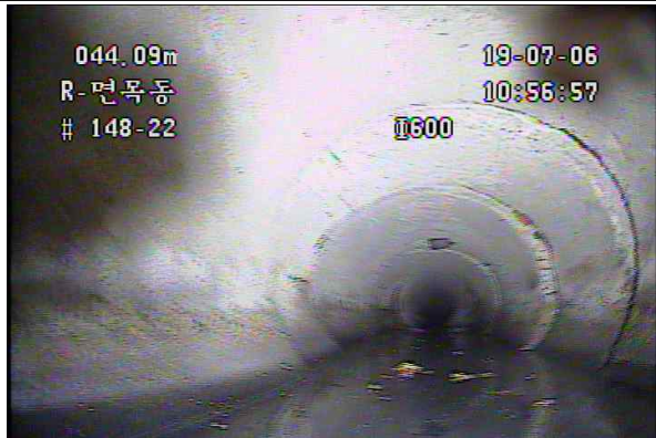
하수관 파손 및 이음부 단차