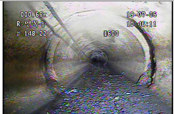
하수관로 노후화로 인한 파손