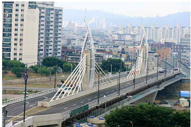
< 돛단배 형상화 >