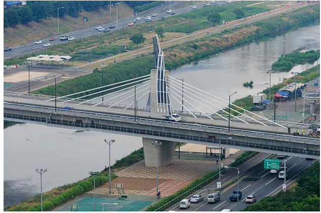
< 주 탑 >