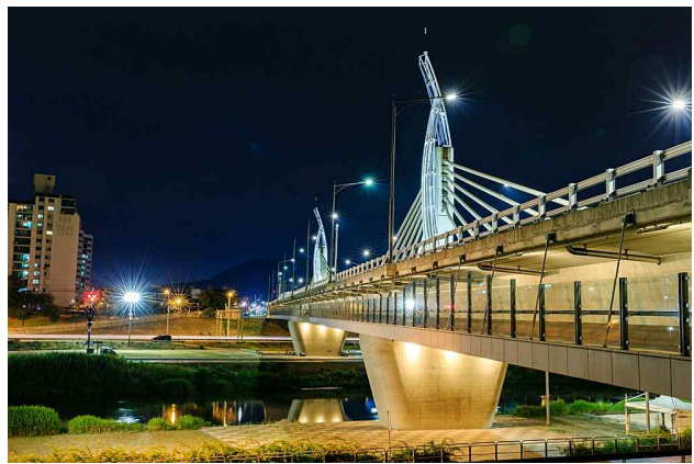
< 보행데크 >