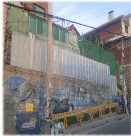
낙석방지망 설치 (A = 39㎡)