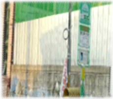
펜스설치 (L = 13m)