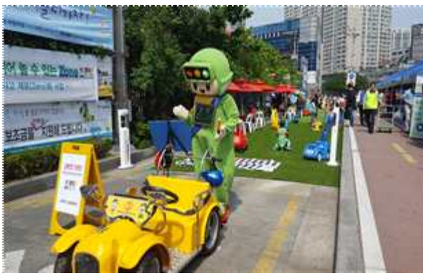
어린이 교통안전 놀이터