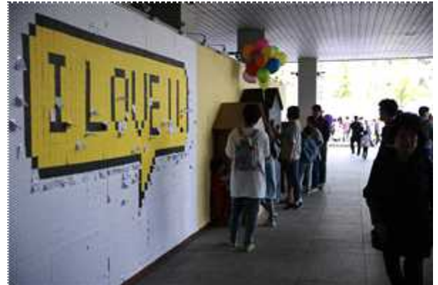
1층 어린이 게시판