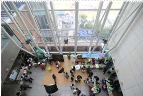
구청4층 로비 부스