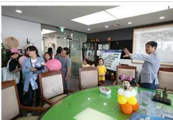
1일 구청장실 체험