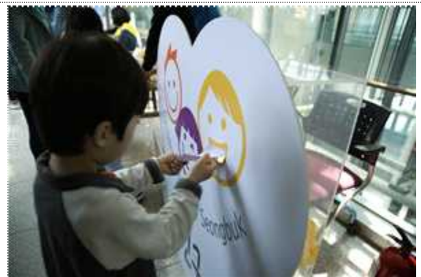
구청4층 아워소 의견함