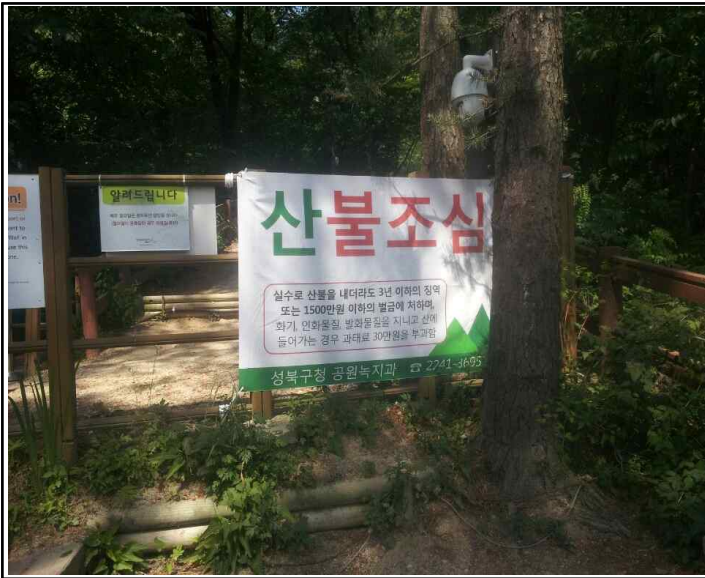
산불예방 현수막 게첩