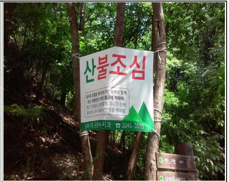
산불예방 현수막 게첩