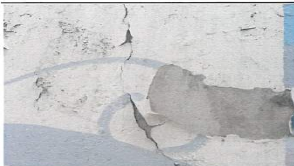
콘크리트 부식, 수직균열 및 도막 박락 전경