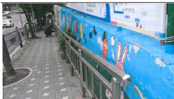
도로옹벽 손상조사 전경