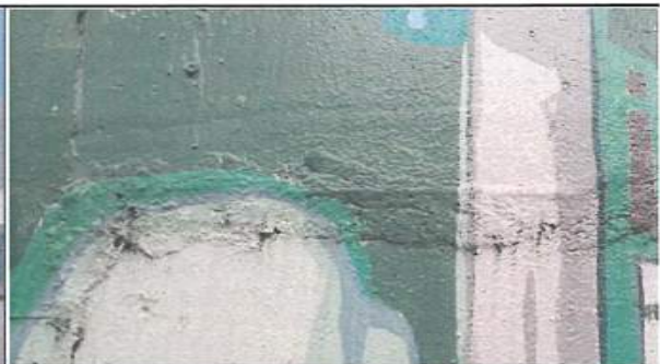
콘크리트 부식, 수평균열 및 도막 박락 전경