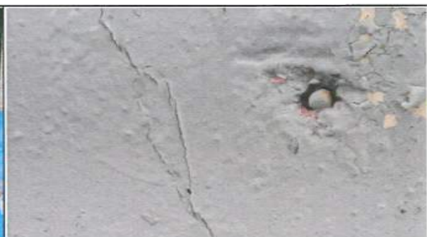
콘크리트 부식, 수직균열 및 도막 박락 전경