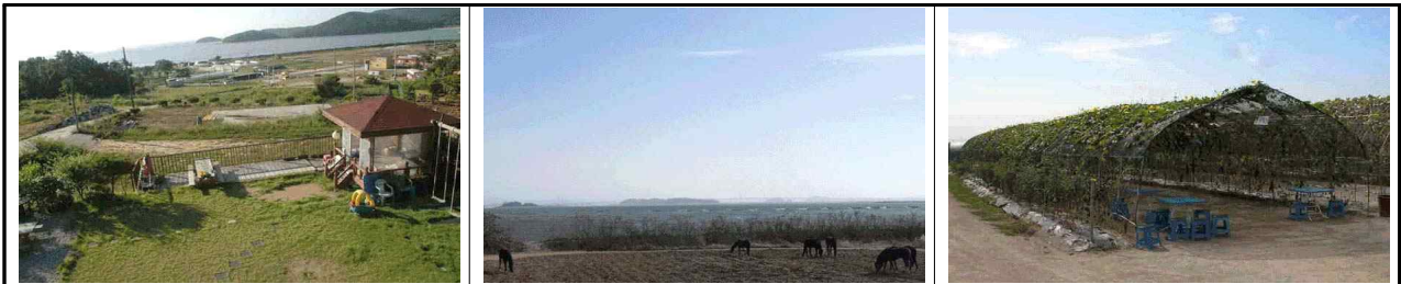
농장 체험장(약 2만평)