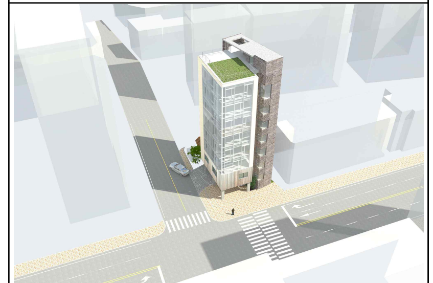
조 감 도