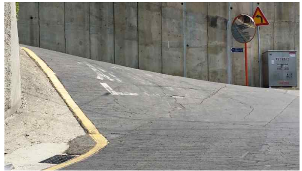
노면표시 재도색 (봉은중학교 후문방향 급경사로)