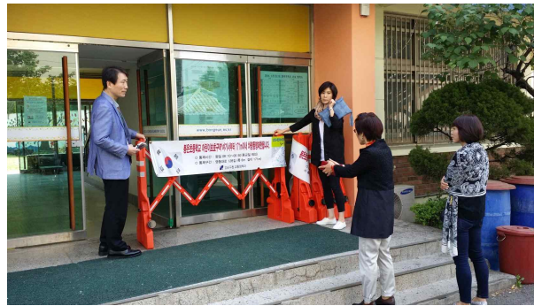
차량통제 접이식 안전펜스 정비(교체)