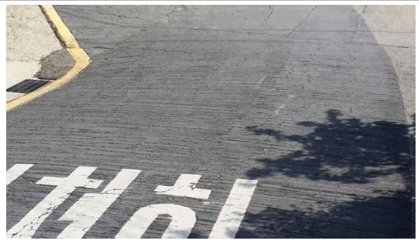
미끄럼방지시설 재포장 정비 (봉은중학교 후문 급경사로)