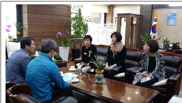
봉은초교 어린이보호구역 간담회