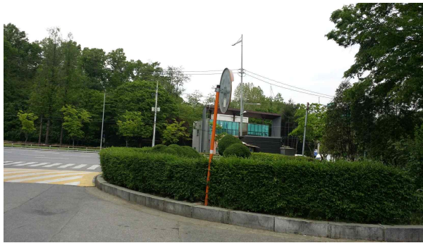
도로반사경 정비(방향 틀어짐) (밤고개로34길 4 세곡부동산 주변)