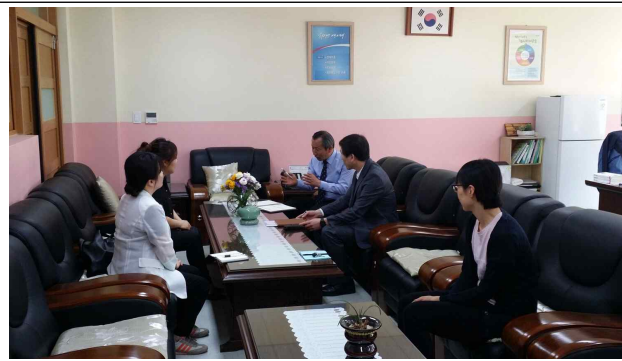
대왕초교 어린이보호구역 간담회