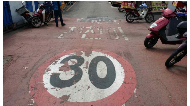
어린이보호구역 훼손 노면표시 재도색 (밤고개로34길 2개소)