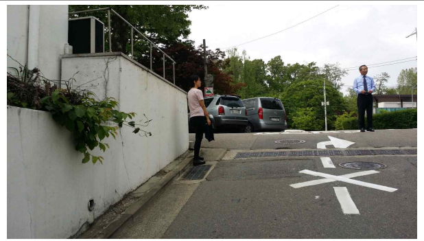
도로반사경 신설(좌측) (세곡부동산옆 급경사로 시야확보)