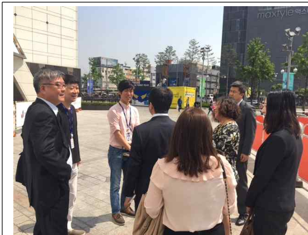
동대문 패션타운 시찰