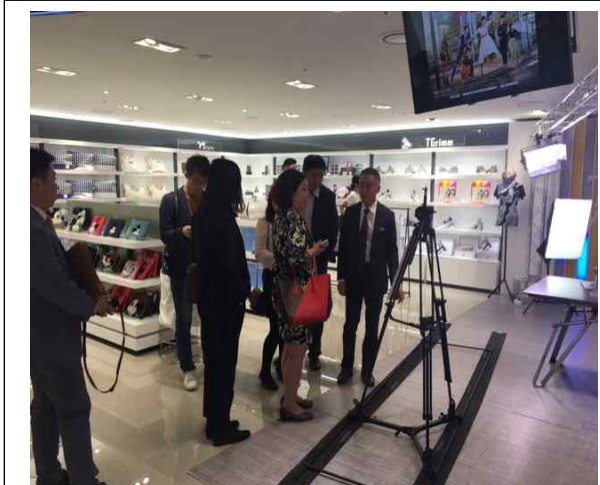
동대문 패션타운 시찰