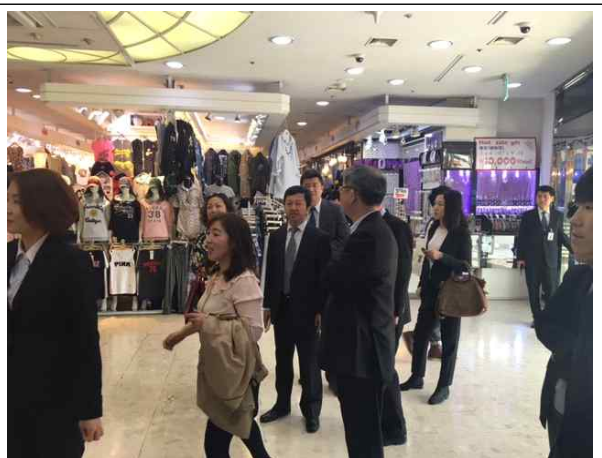
인사동 SM면세점 시찰