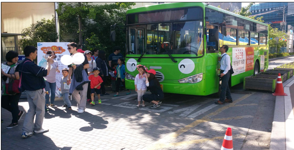
(2015.5.5. 타요버스(로기) 교통안전교육 - 교통행정과)