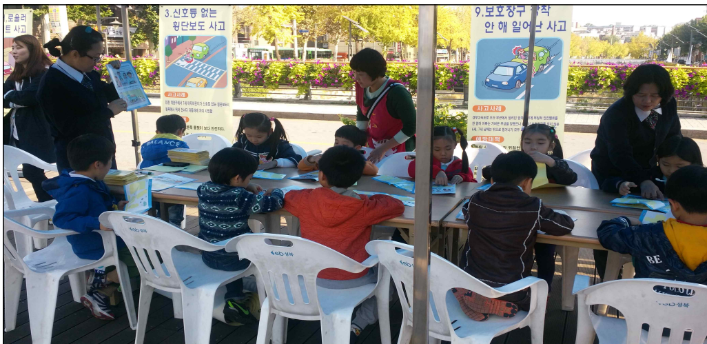
(2014.10.22. 바람마당 어린이 교통안전교육 - 교통행정과)