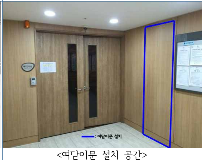
<여닫이문 설치 공간>