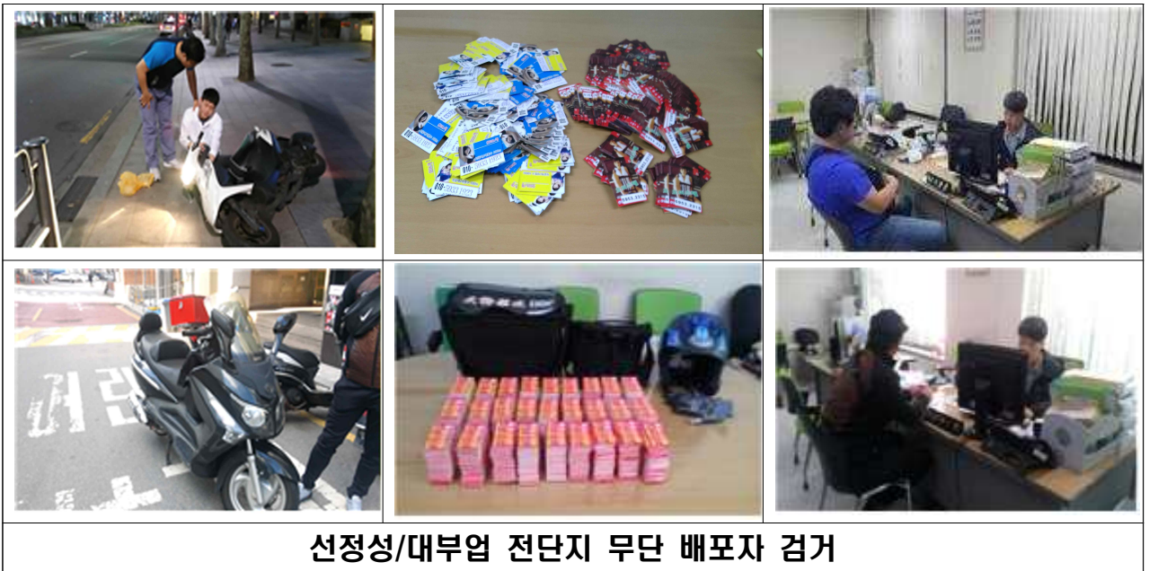
선정성/대부업 전단지 무단 배포자 검거