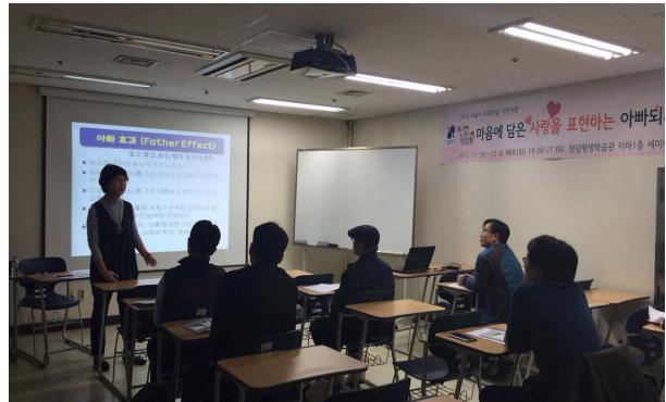
<마음에 담은 사랑을 표현하는 아빠되기>