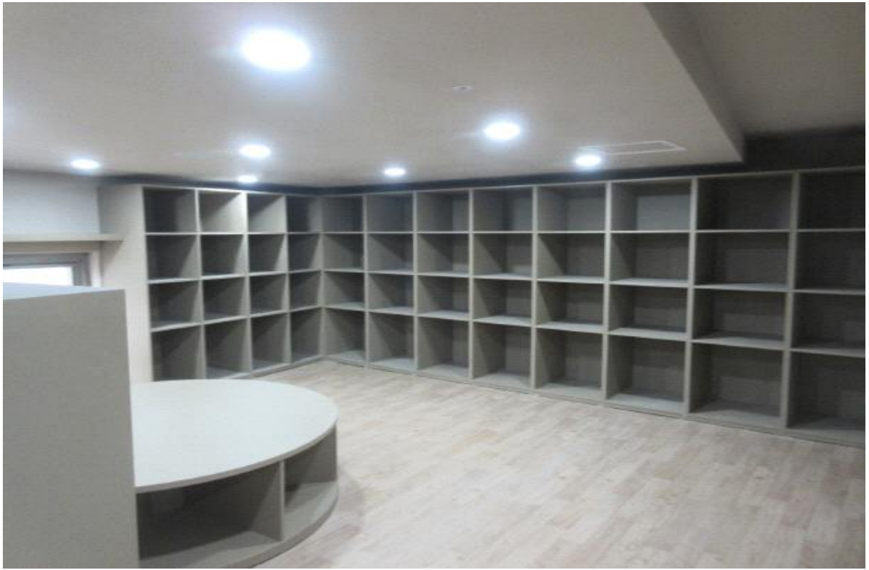
장난감 전시실 1