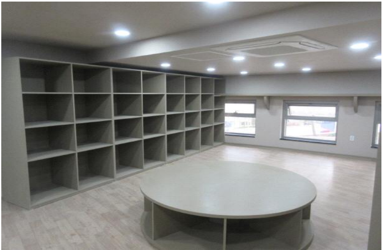
장난감 전시실 2