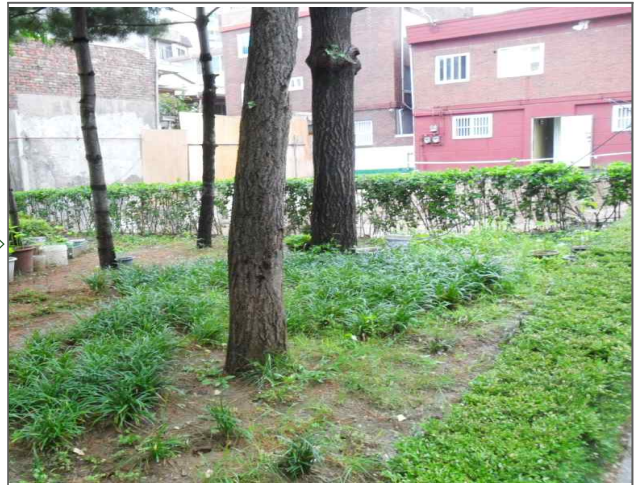
공원녹지분야 적출내용: 공원펜스 방치 (공원녹지과) 적출위치: 자양로42길 44 (구의2동 60-8)