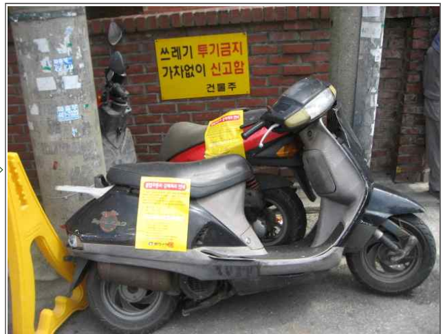
교통분야 적출내용: 방치오토바이2대 (교통행정과) 적출위치: 아차산로62길 14-2 (구의3동 218-10)