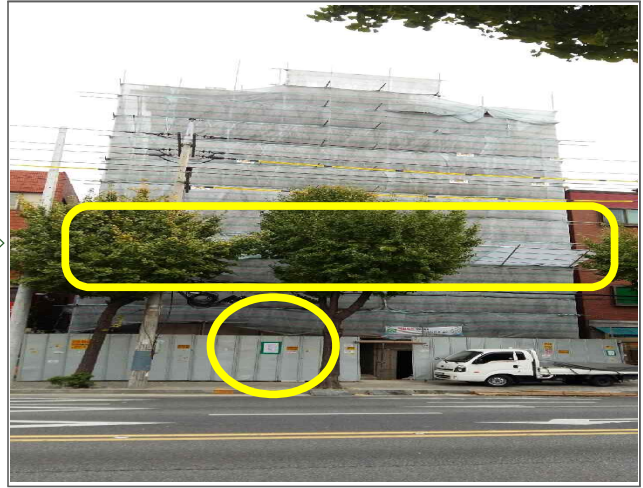
건축분야 적출내용: 낙하물 안전망 및 공사안내문 미설치 (건축과) 적출위치: 용마산로 146 (중곡4동 18-22)