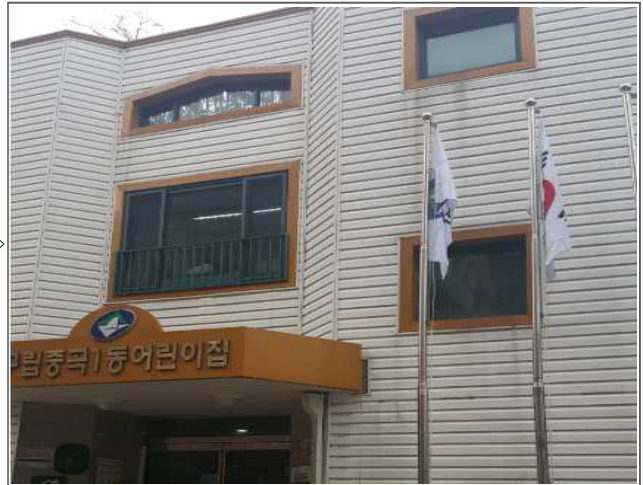
기타분야 적출내용: 태극기, 구기 미계양 (가정복지과) 적출위치: 능동로43길 27-14 (중곡1동 258-17)