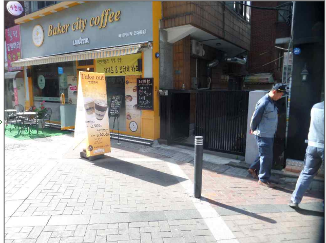
도로분야 적출내용: 블라드 파손 (도로과) 적출위치: 동일로20길 84 (자양4동 6-30)