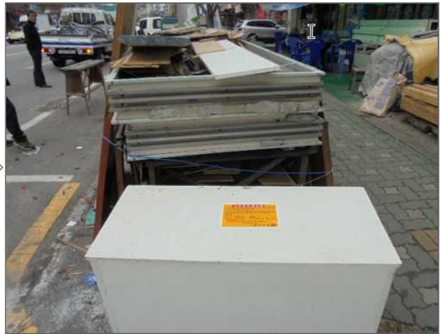
가로정비분야 적출내용: 도로변 무단적치 적출위치: 긴고랑로61 (중곡2동39-62)