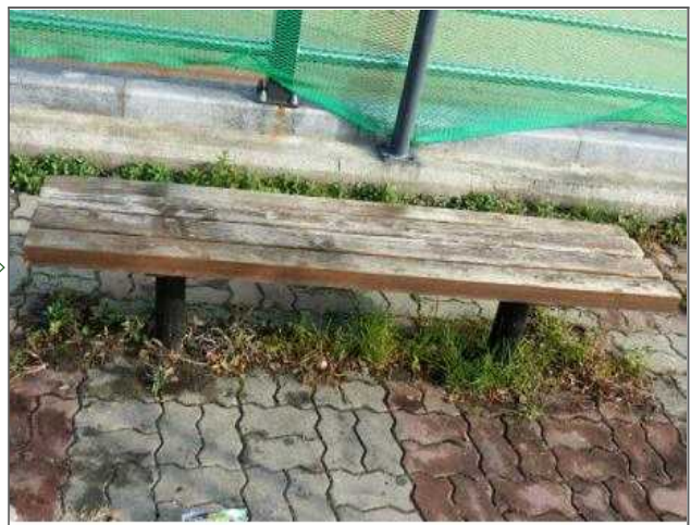
치수분야 적출내용: 벤치파손 (안전치수방재과) 적출위치: 중랑천 체육공원 족구장