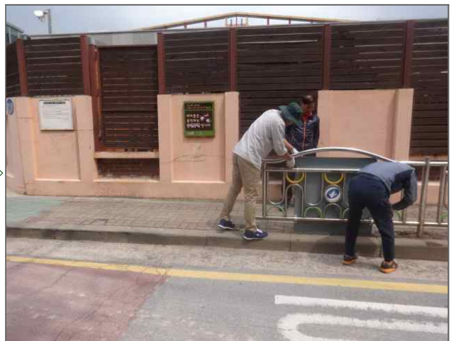
광고물분야 적출내용: 성동초등학교 통학로 불법간판 (도시디자인과) 적출위치: 자양로4길 63 (자양2동 694-1)