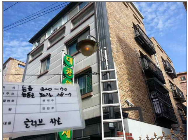
보안등분야 적출내용: 보안등 글로브 파손 (도로과) 적출위치: 능동로32길 28-7 (능동 320-70)