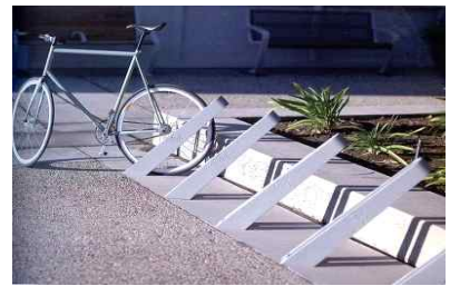
자전거보관대 시각적 개선(주변 환경과의 조화)