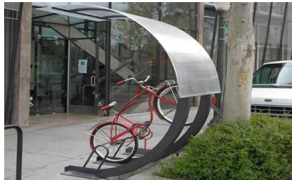
개방감(투명한 비가림)을 유지한 디자인