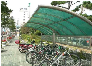
[금지] 과도한 규모, 시각적 차폐, 주변과 조화되지 않는 렉산의 색상 및 고풍택 재질이 적용된 디자인