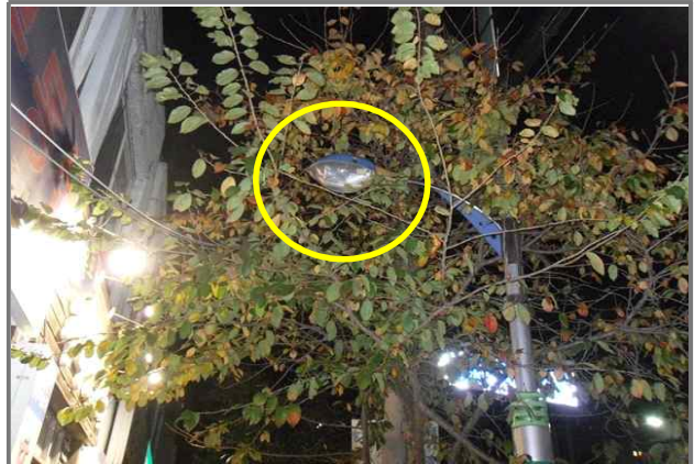
4 위치 긴고랑로 103 (중곡2동 56-18) 내용 가로등 부점등 (도로과)