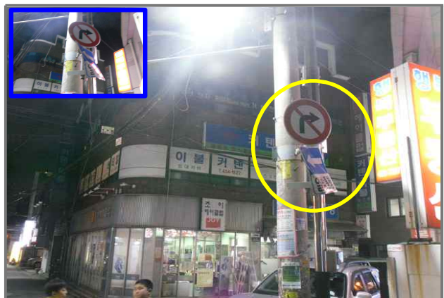
12 위치 긴고랑로15길 15 (중곡2동 31-41) 내용 도로표지판 훼손 (도로과)