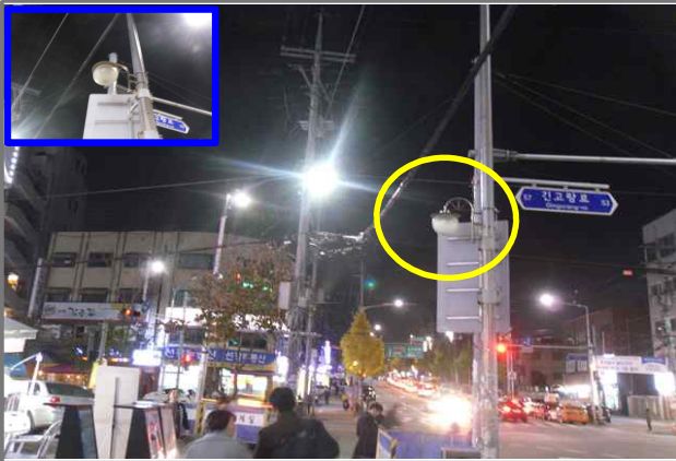
15 위치 능동로 372 (중곡2동 40-14) 내용 가로등 부점등 (도로과)