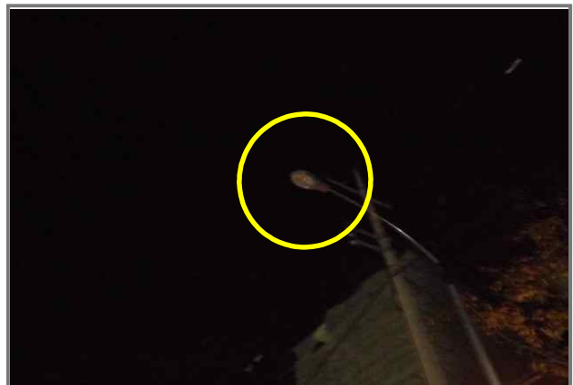
24 위치 긴고랑로 82, 86, 92, 96, 96-1, 102 내용 가로등 부점등 6개 (도로과)