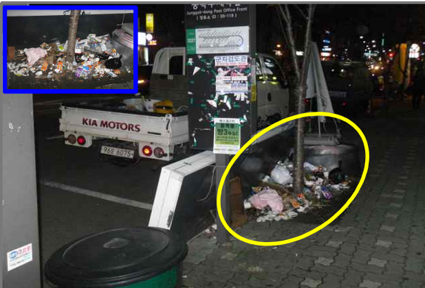
9 위치 긴고랑로 71 (중곡2동 39-38) 내용 무단투기 쓰레기 (청소과)