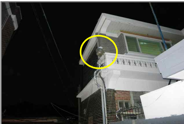
29 위치 김고량로26길 44 (중곡2동 53-24) 내용 보안등 부점등 (도로과)