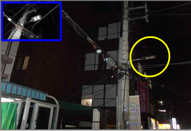
13 위치 능동로50길 8 (중곡2동 31-2) 내용 보안등 부점등 (도로과)