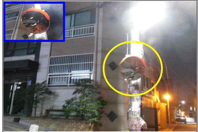
22 위치 용마산로3길 30 (중곡2동 121-42) 내용 반사경 파손 (교통행정과)