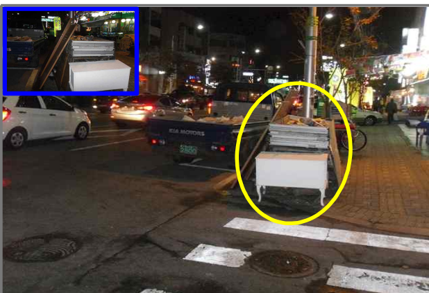
11 위치 긴고랑로 61 (중곡2동 39-62) 내용 도로변 무단적치 (건설관리과)