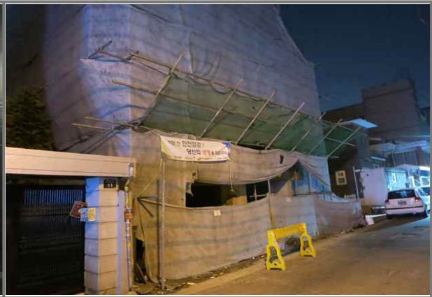
긴고랑로16길 86 (중곡2동 161-36) 공사안내문 미설치