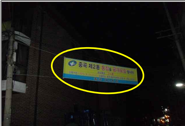
3 위치 긴고랑로29길 18 (중곡2동 150-134) 내용 기한 지난 현수막 정비 (중곡2동)