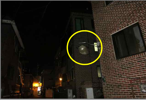
31 위치 긴고랑로30길 27 (중곡2동 124-28) 내용 보안등 부점등 (도로과)