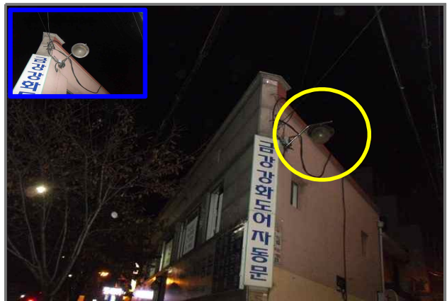
6 위치 긴고랑로 95 (중곡2동 150-183) 내용 보안등 부점등 (도로과)