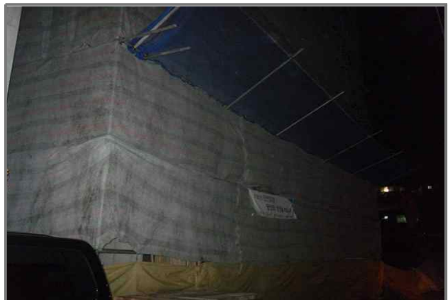
18 위치 긴고랑로27길 20 (중곡2동 149-18) 내용 공사안내문 미설치 (건축과)