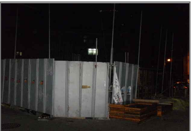
긴고랑로23길 20 (중곡2동 36-9) 공사안내문 미설치