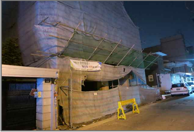
25 위치 김고량로16길 86 (중곡2동 161-36) 내용 공사 안내문 미설치 (건축과)