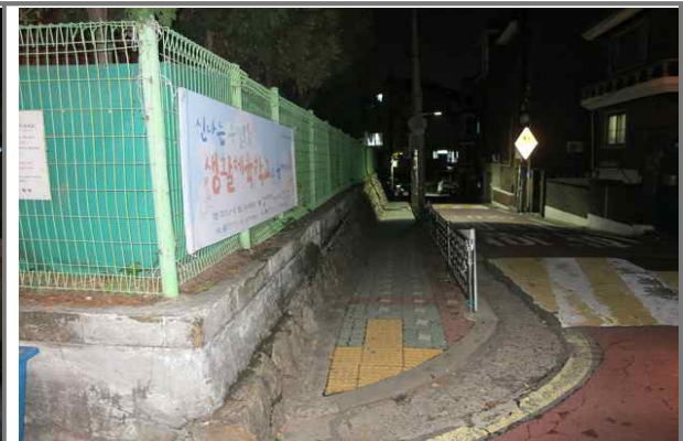
용마초등학교 후문 통학로