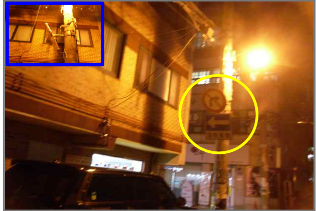
8 위치 능동로50길 36 (중곡2동 34-26) 내용 도로안내판 나사 풀림 (도로과)