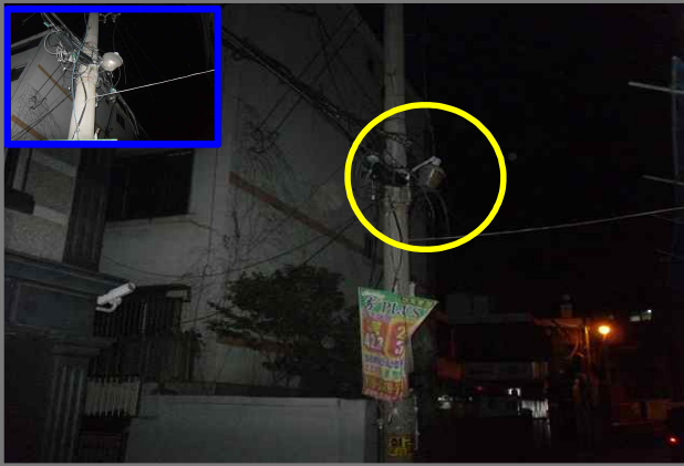
7 위치 긴고랑로27길 15 (중곡2동 149-11) 내용 보안등 부점등 (도로과)