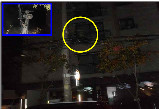
5 위치 긴고랑로 100 (중곡2동 150-214) 내용 가로등 부점등 (도로과)