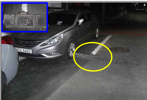
23 위치 긴고랑로20길 68 (중곡2동 159-17) 내용 빗물받이 측구 파손 (안전치수방재과)