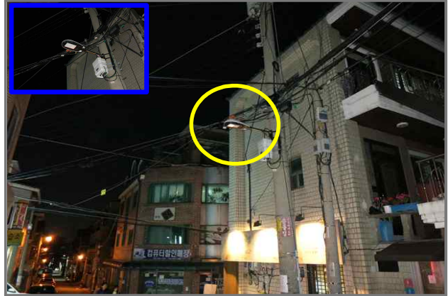
28 위치 천호대로119길 58 (중곡2동 121-30) 내용 보안등 부점등 (도로과)