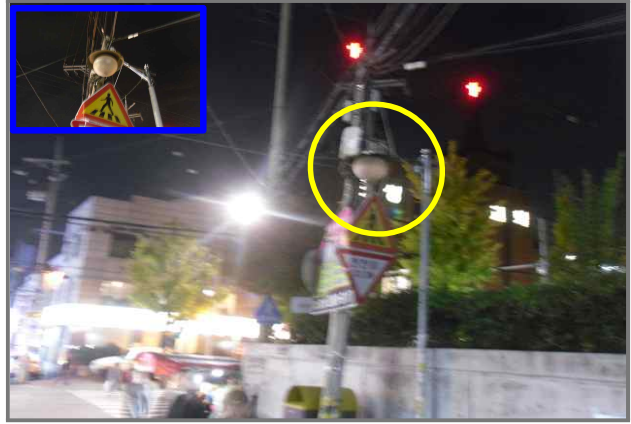
14 위치 능동로 392 (중곡2동 31-1) 내용 보안등 부점등 (도로과)