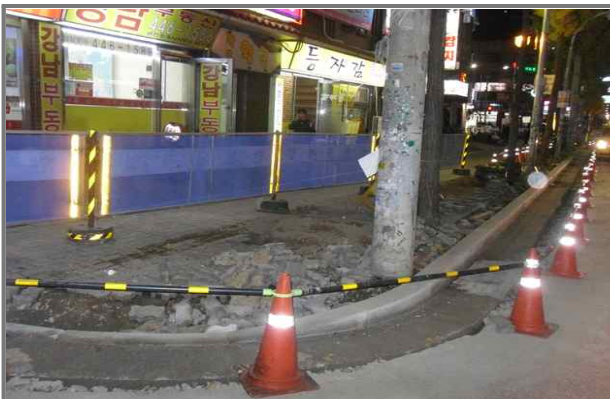
능동로변 도로측구 경계석 정비