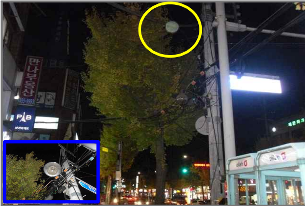
1 위치 용마산로 45 (중곡2동 123-1) 내용 가로등 부점등 (도로과)