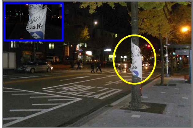
2 위치 용마산로 97 (중곡2동 105-104) 내용 공사안내 현수막 정비 (도시디자인과)