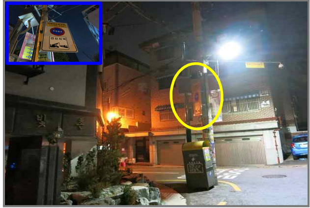
32 위치 용마산로3길 57 (중곡2동 133-5) 내용 어린이보호구역 안내판 방향 (교통행정과)