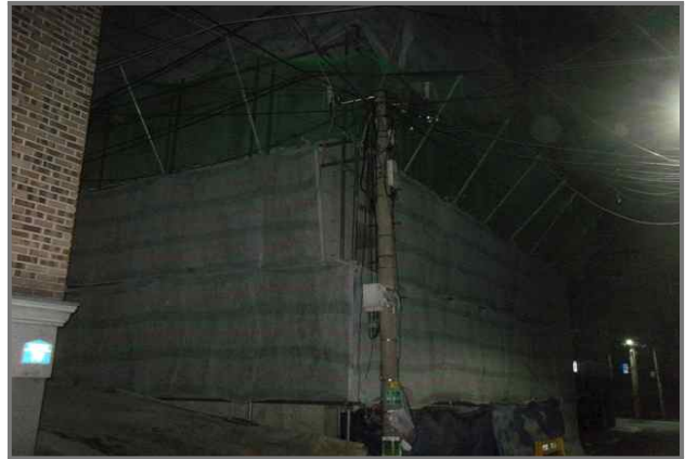
20 위치 긴고랑로20길 83 (중곡2동 141-33) 내용 공사안내문 미설치 (건축과)