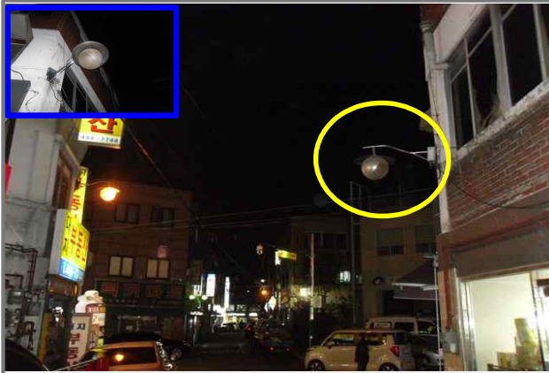
21 위치 용마산로7길 11 (중곡2동 124-1) 내용 보안등 부점등 (도로과)