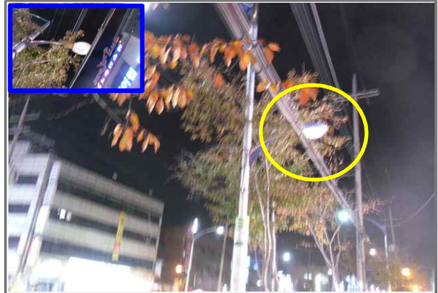
16 위치 긴고랑로 60 (중곡2동 41-1) 내용 가로등 부점등 (도로과)