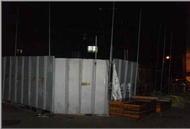
19 위치 긴고랑로23길 20 (중곡2동 36-9) 내용 공사안내문 미설치 (건축과)