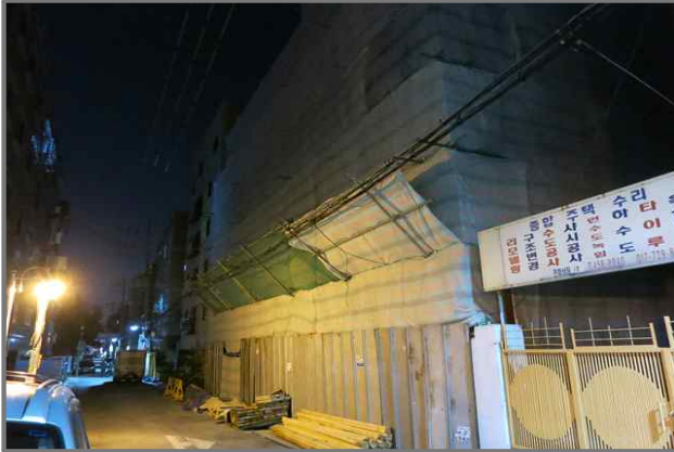
27 위치 천호대로123길 62 (중곡2동 126-55) 내용 공사안내문 미설치 (건축과)