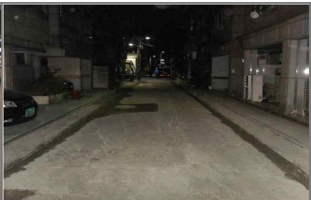
용마산로7길 45 골목 도로포장