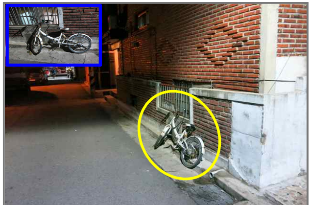
30 위치 천호대로123길 80 (중곡2동 126-80) 내용 방치 자전거 (건설관리과)