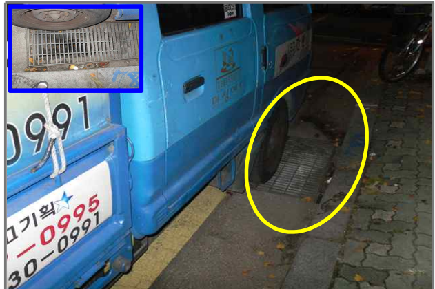
10 위치 긴고랑로 69 (중곡2동 39-40) 내용 빗물받이 측구 파손 (안전치수방재과)