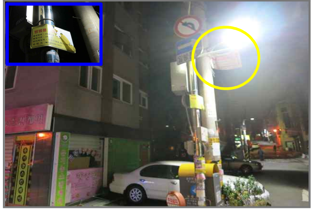
26 위치 용마산로3길 13 (중곡2동 118-2) 내용 방범용CCTV 안내문 훼손 (자치행정과)