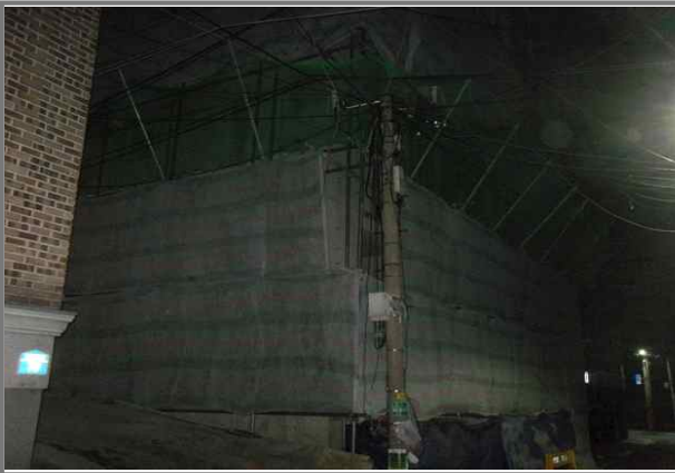
긴고랑로20길 83 (중곡2동 141-33) 공사안내문 미설치