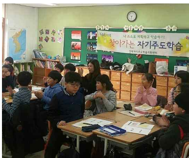
자기주도학습 강의 (찾아가는 자기주도학습)