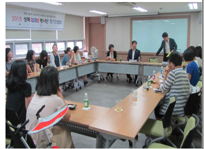
정기간담회 등을 통한 소통과 재능공유