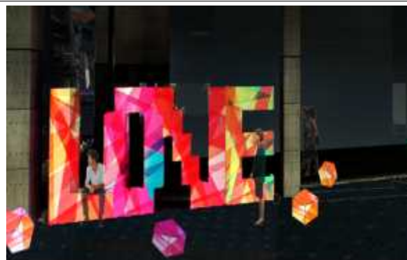
삼풍 넥서스 앞