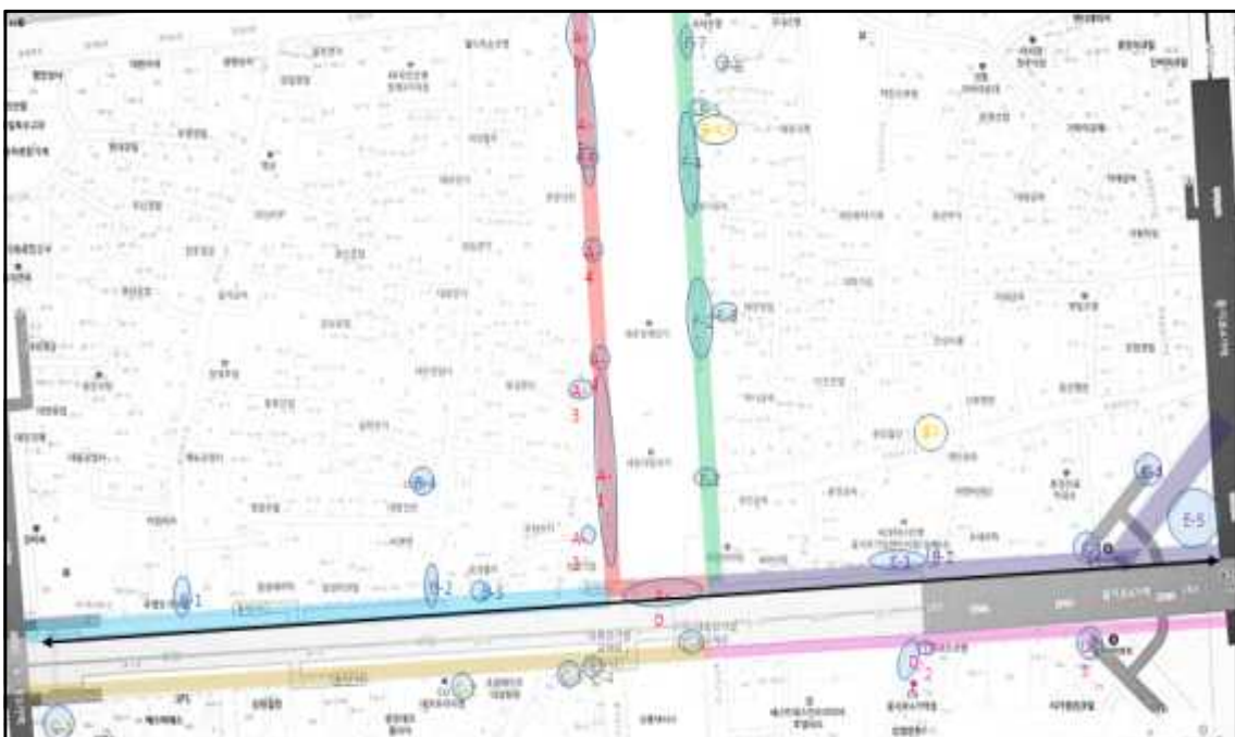
(조명 설치 위치)