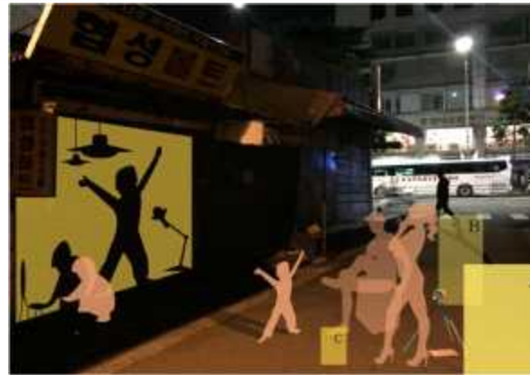
을지로 인근 점포