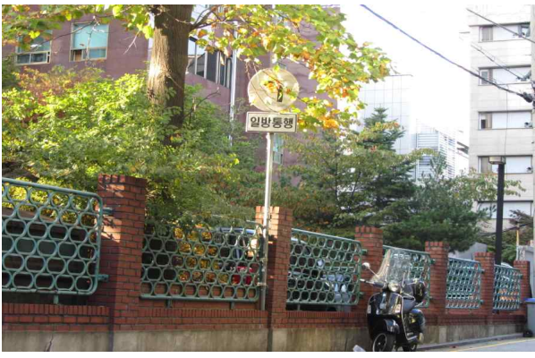
논현1동 일방통행 표지판 훼손