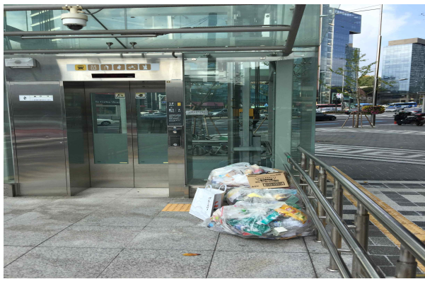
봉은사역 앞 쓰레기 무단 적치