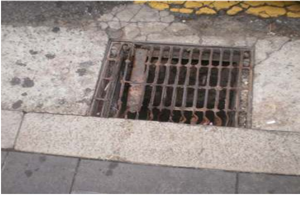
선릉로 빗물받이 파손