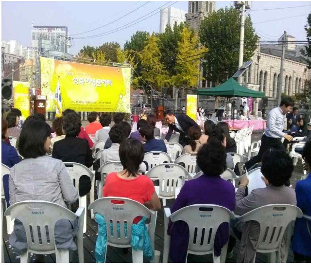
행사 바로 직전