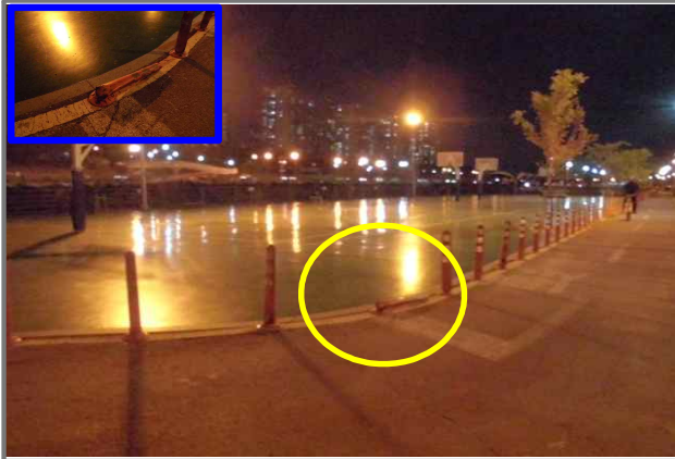
21 위치 중랑천 체육공원 농구장 내용 도로분리봉 파손 (안전치수방재과)