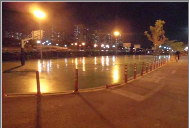
중랑천 체육공원 농구장