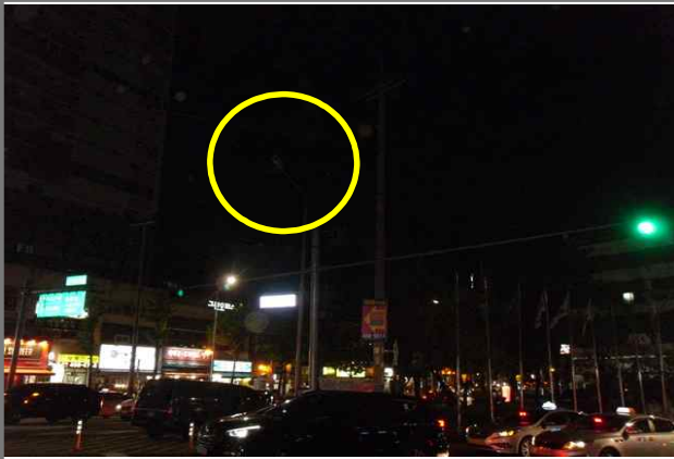
3 위치 용마산로 171 (중곡3동 169-80) 삼거리 내용 가로등 부점등 (도로과)