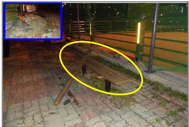
24 위치 중랑천 체육공원 족구장 내용 벤치파손 및 흙더미 (안전치수방재과)