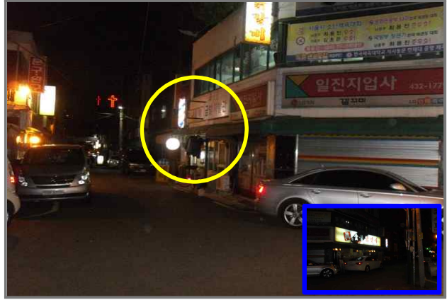
14 위치 답십리로82길 18 (중곡3동 571-3) 내용 짜인볼 3개 (도시디자인과)