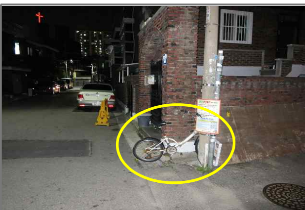
17 위치 동일로76가길 54 (중곡3동 177-26) 내용 폐자전거 (건설관리과)