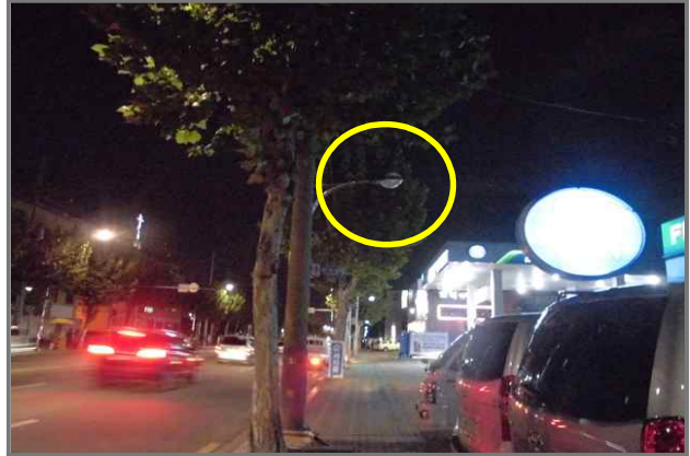
28 위치 동일로 394 (중곡3동 235-3) 내용 가로등 부점등 (도로과)