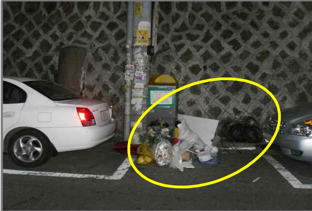
9 위치 면목로12길 27 (중곡3동 170-10) 내용 쓰레기 무단투기 (청소과)