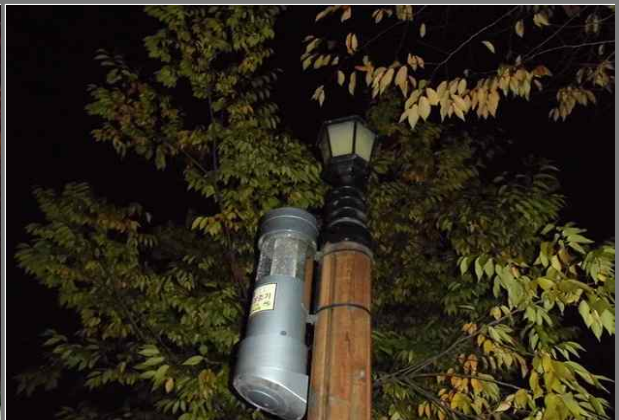
제방길 보안등 부점등