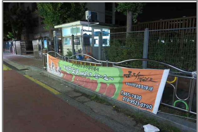
16 위치 동일로72길 43 (중곡3동 191-69) 내용 불법현수막 정비 (중곡3동)