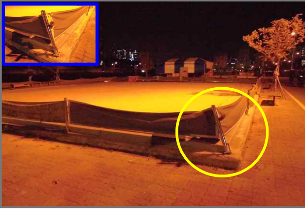
25 위치 중랑천 체육공원 게이트볼장 내용 고정봉 훼손 (안전치수방재과)