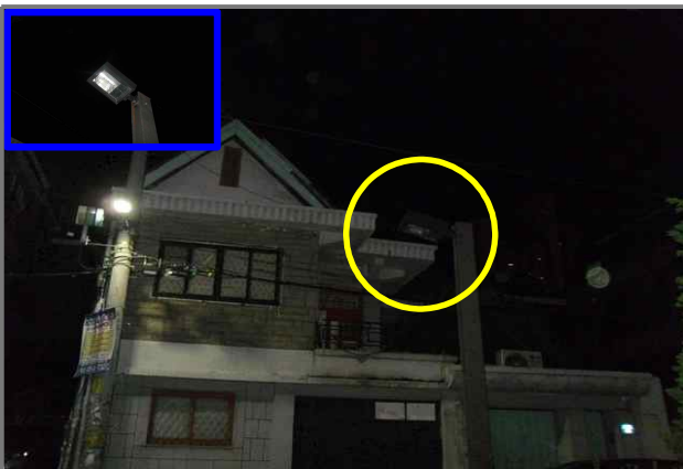
5 위치 용마산로33길 25 (중곡3동 195-1) 내용 공원등 부점등 (공원녹지과)