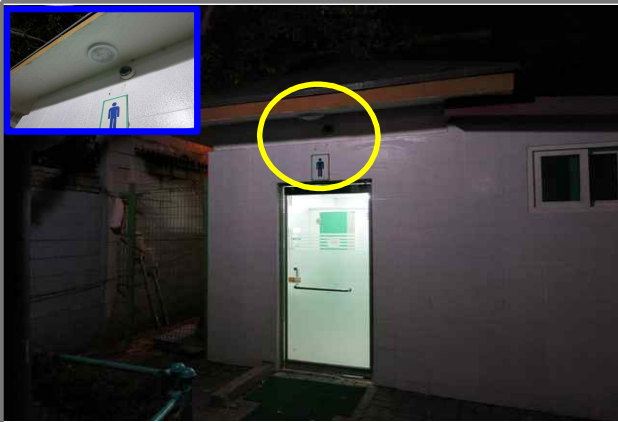
15 위치 동일로76나길 20 (중곡3동 695) 내용 배나무터공원 화장실 외등 부점등 (청소과)