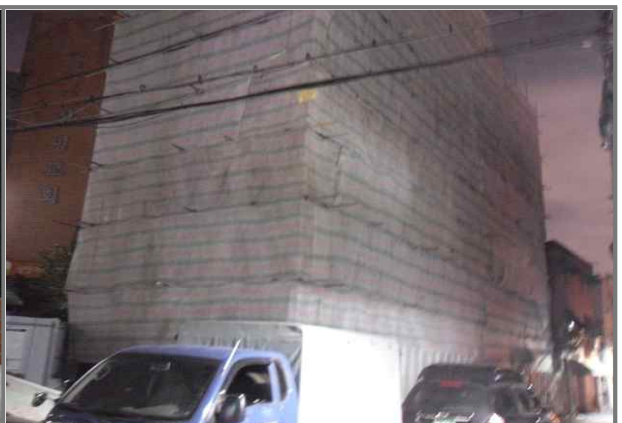
답십리로78길 35 (중곡3동 175-109) 낙하물방지망 미설치, 공사안내문 안보이는곳 설치