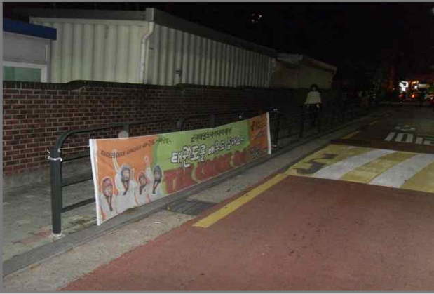
1 위치 긴고랑로13길 59 (중곡3동 220-22) 내용 불법현수막 (중곡3동)