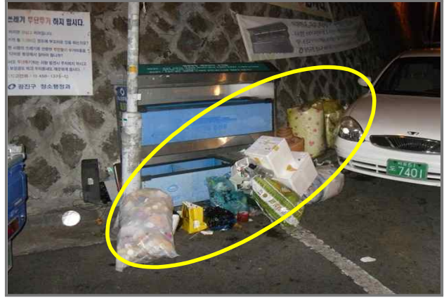
8 위치 면목로12길 37 (중곡3동 170-2) 내용 쓰레기 무단투기 (청소과)