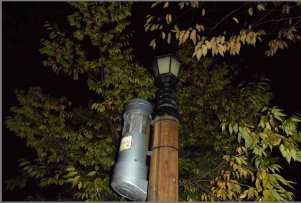
27 위치 중랑천제방길 16 (중곡3동) 내용 보안등 부점등 (도로과)