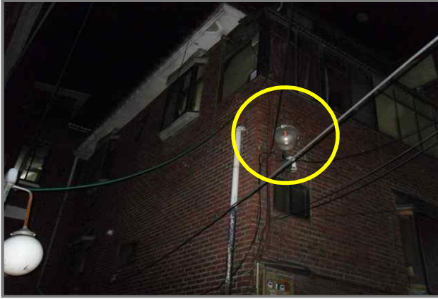
7 위치 답십리로86길 11-4 (중곡3동 544-5) 내용 보안등 부점등 (도로과)