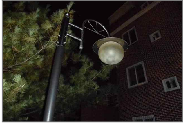
26 위치 중랑천제방길 22-1 (중곡3동) 내용 보안등 부점등 (도로과)