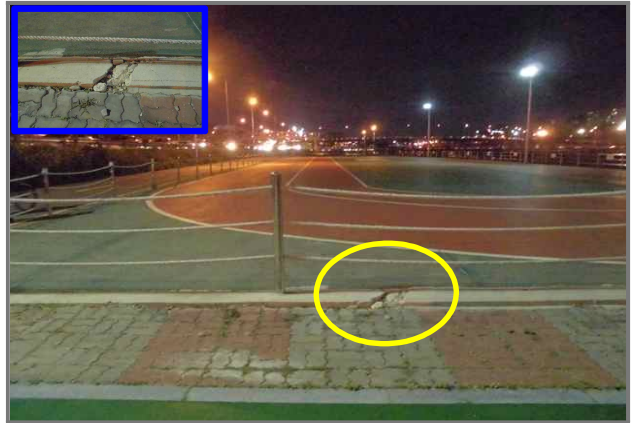
20 위치 중랑천 체육공원 인라인스케이트장 내용 경계석 파손 (안전치수방재과)