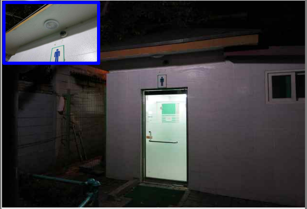
배나무터공원 화장실 외등 부점등