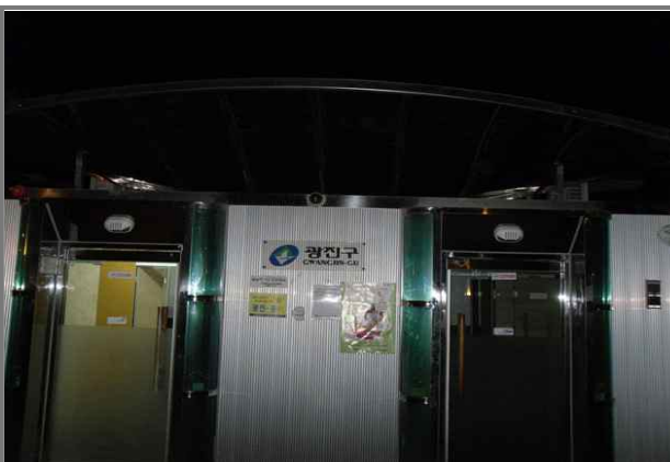
마을마당 화장실 외등 부점등