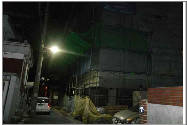
12 위치 답십리로82길 27 (중곡3동 210-22) 내용 공사안내문 미설치 (건축과)