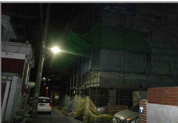
답십리로82길 27 (중곡3동 210-22) 공사안내문 미설치