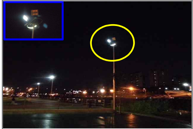
22 위치 중랑천 체육공원 체조장 1-14 내용 조명등 보점등 (도로과)