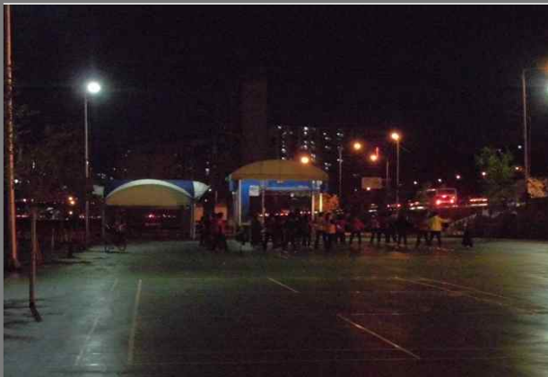
중랑천 체육공원 야간 체조교실