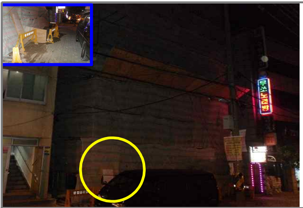
11 위치 중곡3동 548-9 내용 공사안내문 고정 설치 (건축과)