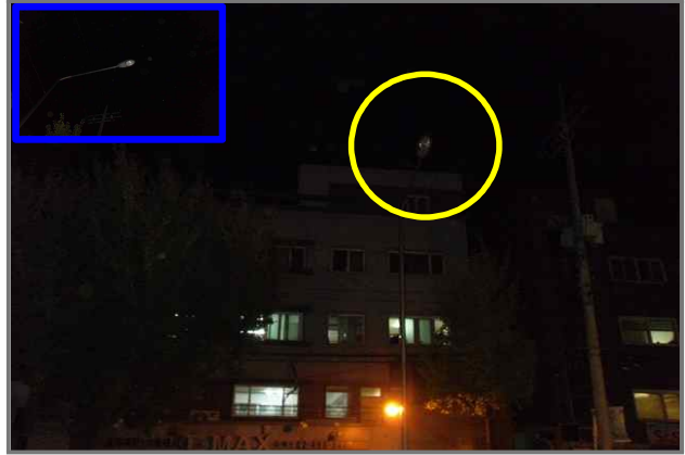
2 위치 능동로 438 (중곡3동 29-81) 내용 가로등 부점등 (도로과)