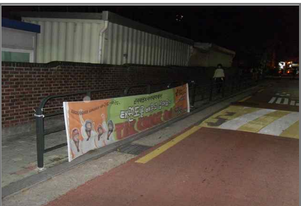
통학로 불법 현수막