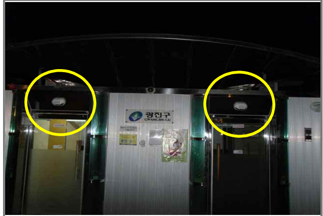
4 위치 용마산로33길 25 (중곡3동 195-1) 내용 화장실 외등 부점등 (청소과)