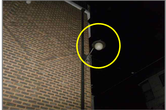
10 위치 능동로50길 25 (중곡3동 30-48) 내용 보안등 부점등 (도로과)