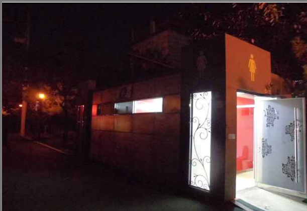
중랑천 제방길 화장실