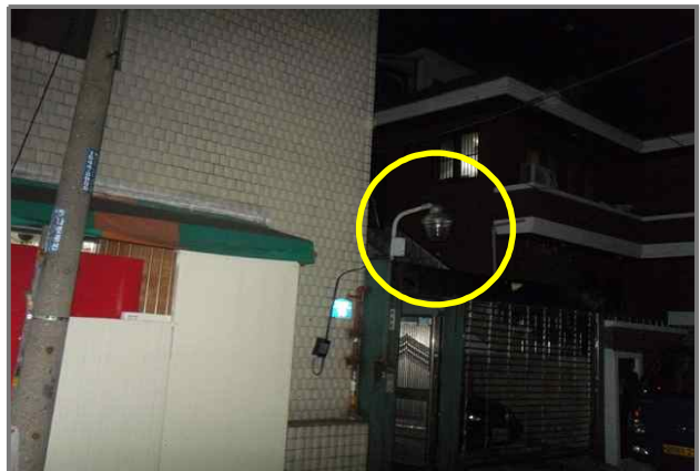
6 위치 답십리로86길 16 (중곡3동 549-6) 내용 보안등 부점등 (도로과)