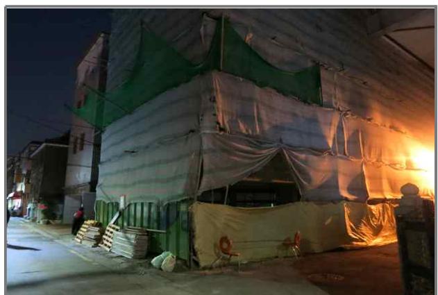
18 위치 중곡3동 191-13 내용 낙하물방지망 훼손 (건축과)