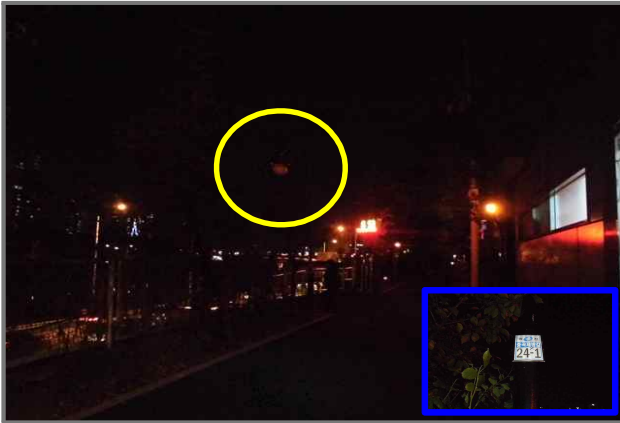
19 위치 중랑천 제방길 24-1 (중곡3동) 내용 보안등 부점등 (도로과)