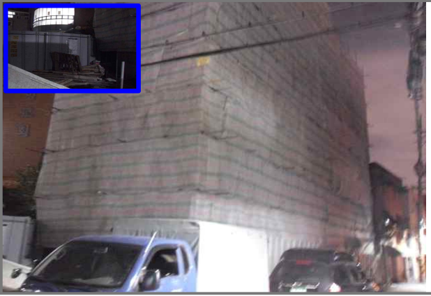
13 위치 답십리로78길 35 (중곡3동 175-109) 내용 공사안내문 안보이는곳 설치 낙하물방지망 미설치 (건축과)