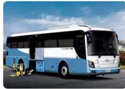
현대 유니버스 (기어 그랜드버스)