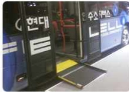
현대 에어로시티, 타운