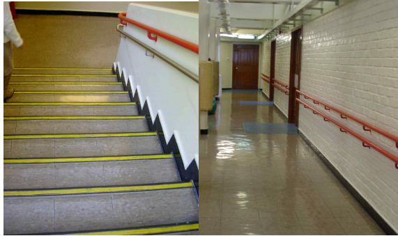
← 좋은 예 : 계단끝표시(좌) 핸드 레일(우)