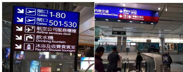
← 좋은 예 : 홍콩 첵랍콕 국제공항 안내표시판