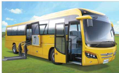
대형 리프트버스 (노출형)