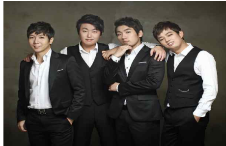
팝페라 그룹 KYLO(카이로)