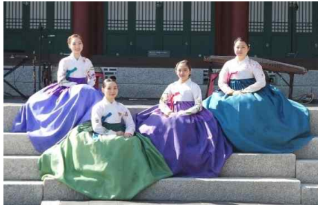
국악 그룹 Nanda(난다)