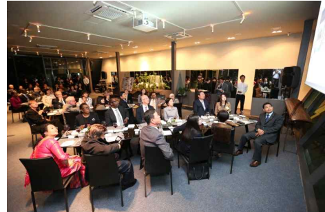
2014 성북에서 아름다운 추억을