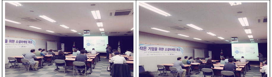
소셜마케팅 교육 사진