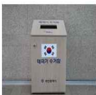
< 국기 수거함 표준 모델 >

- 규격 : 가로 60cm × 세로 50cm × 높이 95cm - 재질 : 합판