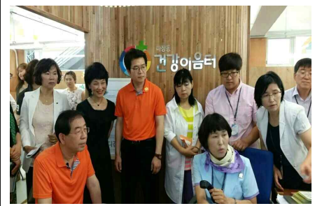
동건강이음터 개소식 및 시장님 현장방문