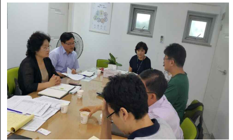
'찾아가는 동주민센터' 동별 모니터링