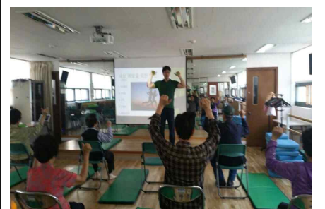
취약동 허약노인 건강 프로그램 운영