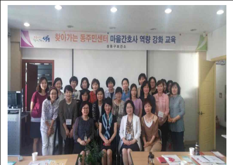
마을 방문간호사 역량 강화 교육