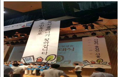
복지 플래너 발대식