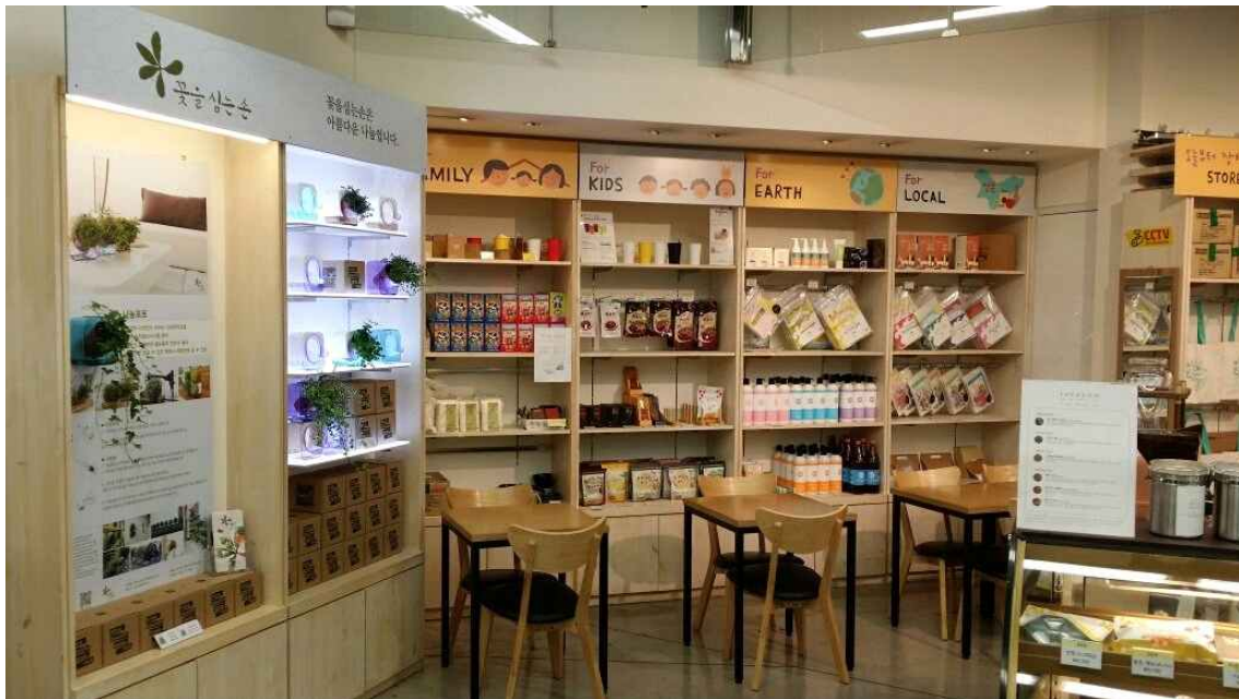
[제품 진열 사진]