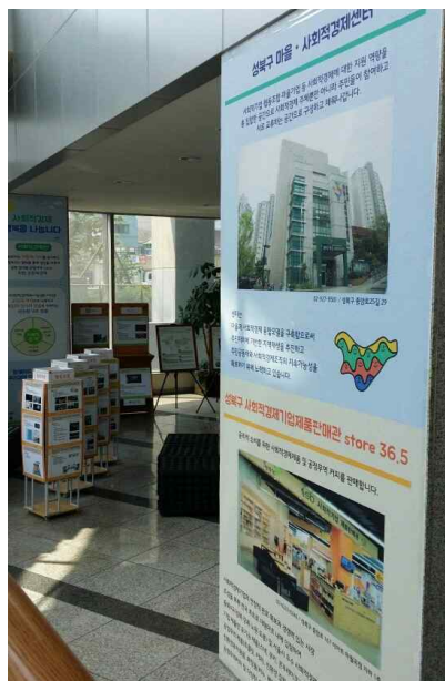
[평생학습관 올라가는 계단]