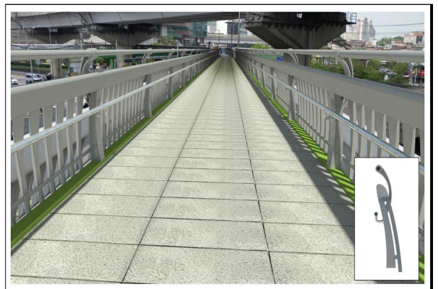
계단 난간 높이 상향 조정