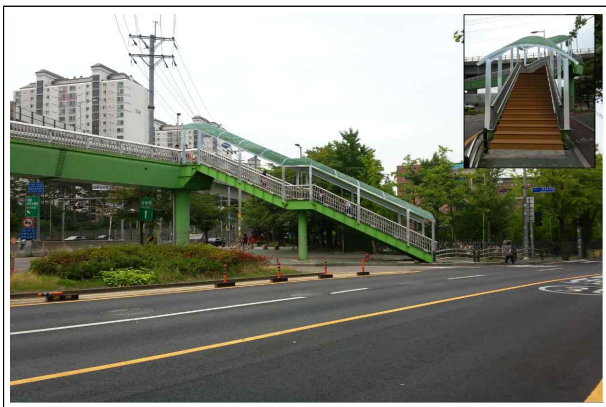
육교 계단구간 캐노피(지붕) 설치 조감도