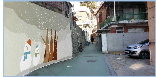
< 겨울 >