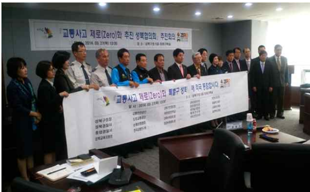
교통사고 제로화 추진 성북협의회 구성 (2014.3.27.)