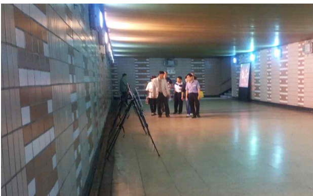
교통안전체험장 조성 추진 (길음지하보도리모델링) (2016.7월 성북구 주민참여예산사업 1위, 9억원 서울시 제출-서울시 본선심사 탈락)