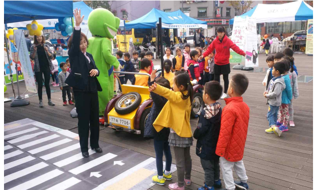
어린이교통안전주간(2014. 10.22~10.24) (바람마당 행사-비예산)