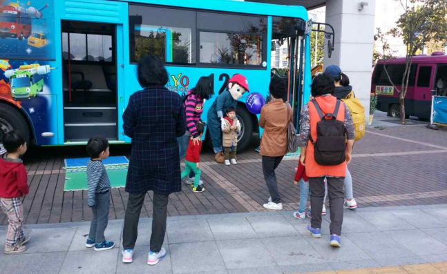
어린이교통안전주간(2014. 10.22~10.24) (진짜 타요버스가 나타났다 -비예산)