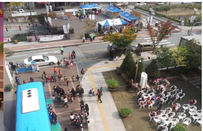
어린이교통안전주간(2014. 10.22~10.24) (바람마당 행사-비예산)