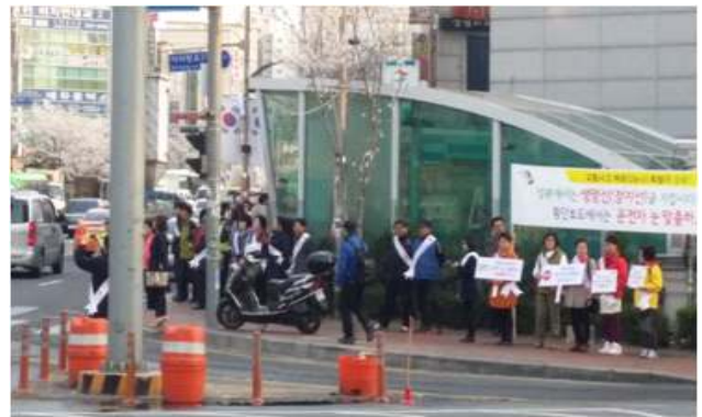
범 구민 교통사고 제로화 캠페인 (2014.4.1. 6개지점 1000여명 참석)