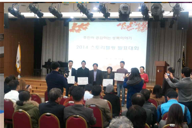
2014 스토리텔링 발표회 3위 (찾아가는 교통안전 분야, 2014.12.18.)