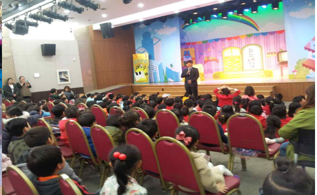
어린이교통안전주간(2014. 10.22~10.24) (노노이야기 공연 6회-서울시공모사업)