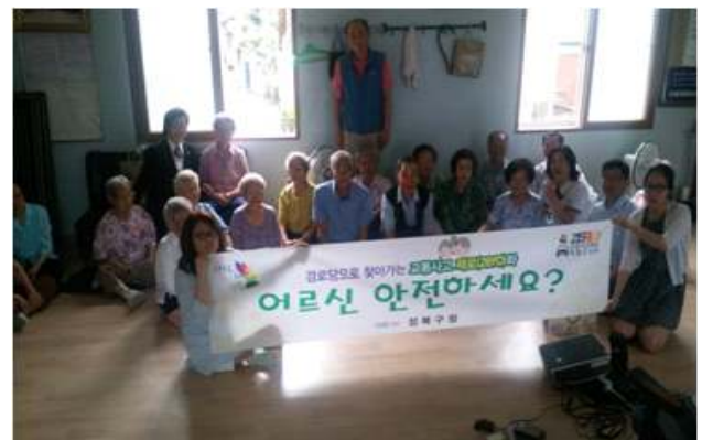
어르신센터에 찾아가는 교통안전교육 (2014.7월 9개 경로당-비예산)