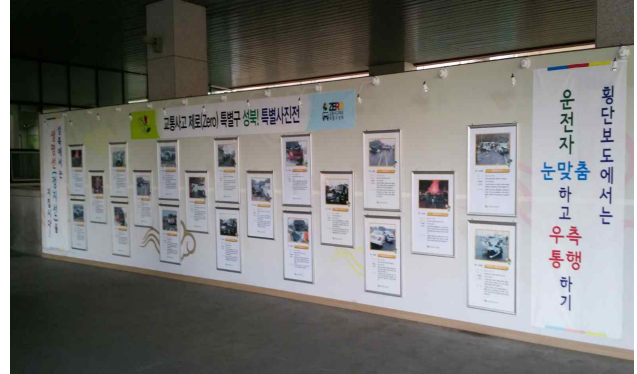
교통사고 제로화 사진전 (2014.3.24.~4.15 성부구청 입구)