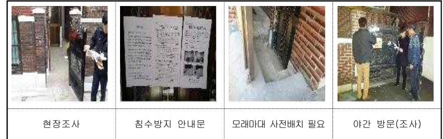
〈현장조사 내용 사진〉