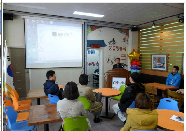
안동구시장 상인회장 시장 소개