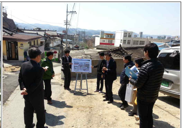
안동시청 관계자 벽화마을 소개