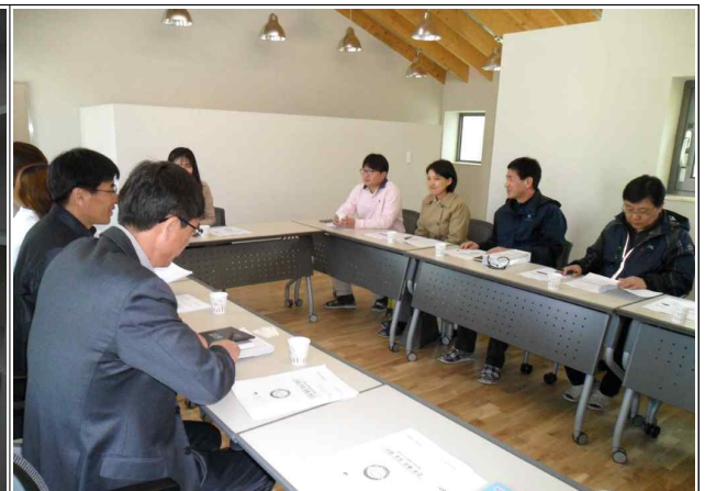
영주시청 관계자 도시재생사업 설명