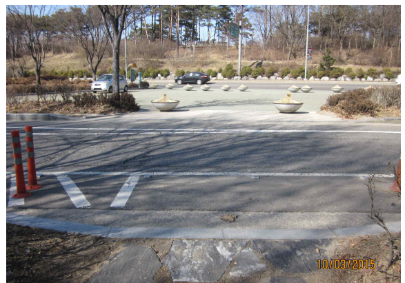
횡단보도 설치 예정지