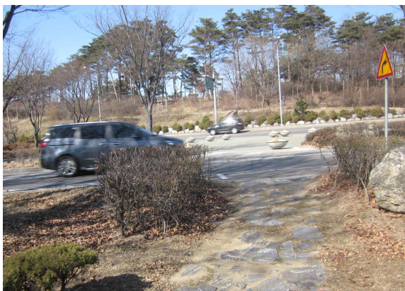
횡단보도 설치 예정지