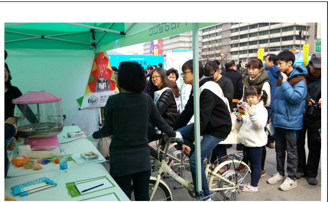
태양열 조리기 설치 및 자전거 발전기를 이용한 숨사탕 만들기