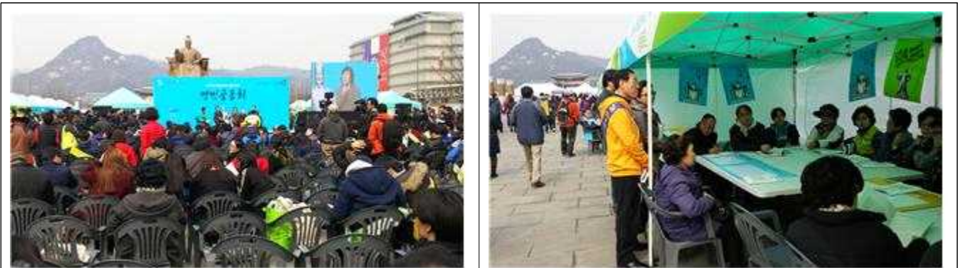
전체토론 및 분야별 심층토론회 참여