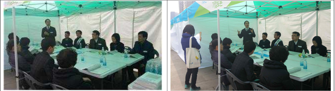
성북구 관내 기업(고대 안암병원) 토론회