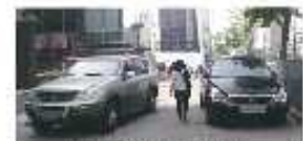
보도위 불법 주차차