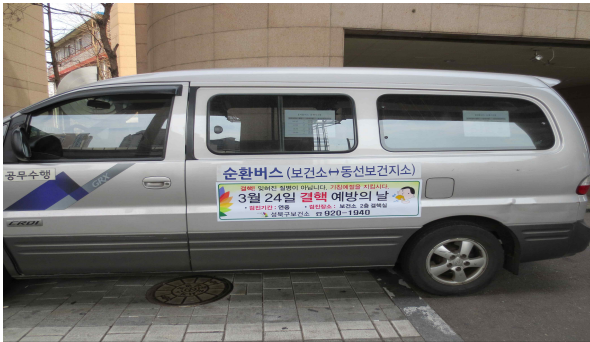
버스 자석스티커 홍보